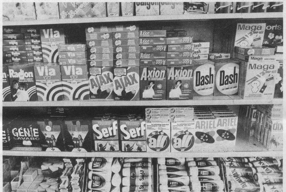
L'équipe d'«A bon entendeur»: des virtuoses de la lecture à travers les emballages.