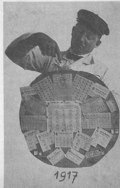
Réd. — Un document qui rappellera bien des mauvais souvenirs à de nombreux lecteurs. La photo date de 1917.

Afin d'illustrer, quant au rationnement, l'excellent article signé André Chabloz (No d'avril 78), je vous adresse une photo de mon père, à l'époque laitier-épicié à l'avenue de Cour, à Lausanne, grimaçant en tenant les divers titres de rationnement posés sur un couvercle de seille à choucroute! J'aime votre journal et je vous remercie de tous vos efforts en faveur des aînés.