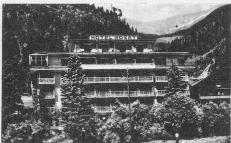
HOTEL ROSAT 1837 Château-d'Ex Altitude 1000 m. Tél. (029) 4 62 12

Cadre tranquille et agréable Grand parc, vue imprenable Idéal pour repos et convalescence - Tout confort - Lift Cuisine très soignée - Sur demande, cuisine à régimes