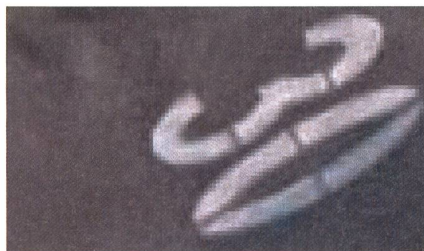
Abb. 3: Ausschnitt aus einer Befliegung mit dem UX: Bodenauflösung 2.6 cm.