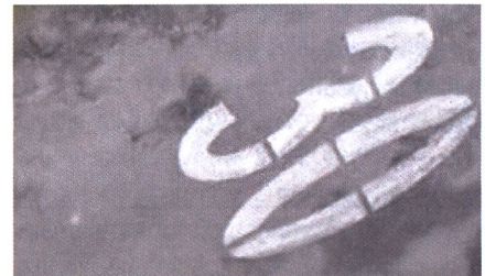
Abb. 4: Ausschnitt aus einer Befliegung mit dem UX5 HP: Bodenauflösung 1.3 cm.

auch so bereits bessere Resultate erzielt. Wenn ganz ohne Passpunkte gearbeitet