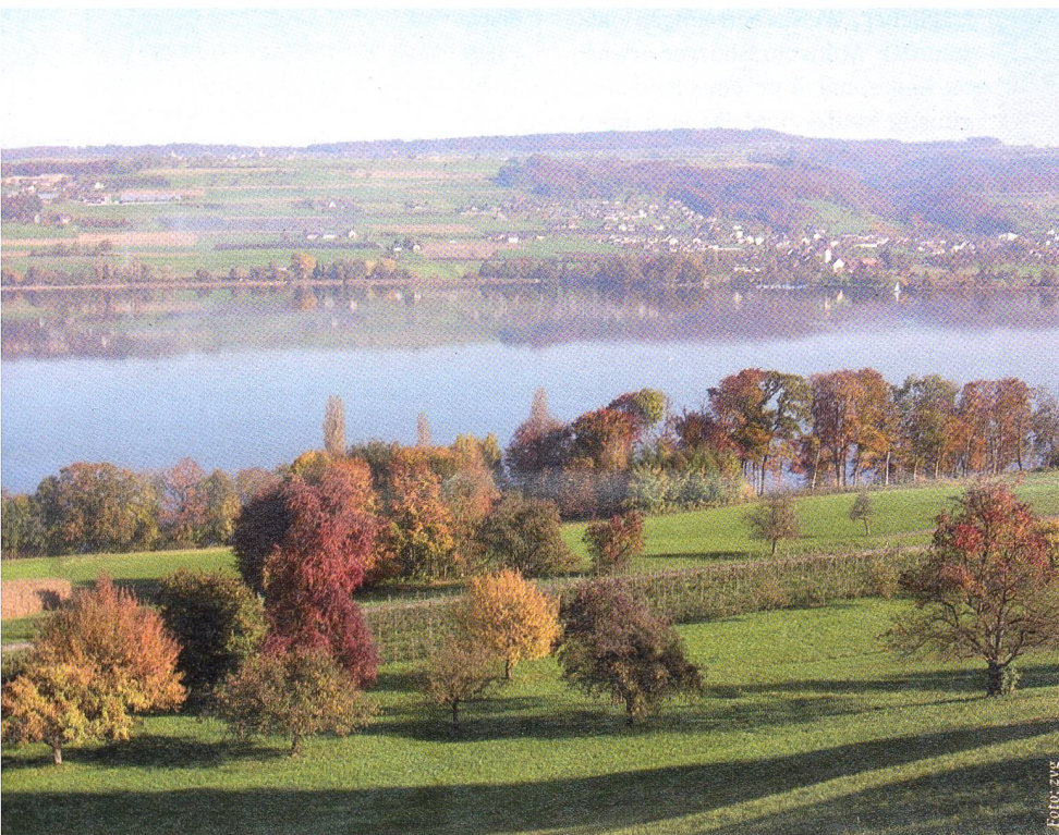
Die naturnahe Landschaft um den Hallwilersee: Die «Visitenkarte des Kantons Aargau» konnte dank Beschwerderecht vor Verschandelung gerettet werden.

Im November stimmen wir über die von der Zürcher FDP-Nationalrätin Doris Fiala lancierten Initiative gegen das Verbandsbeschwerderecht ab. Wem die Natur in der Schweiz am Herzen liegt, legt ein Nein in die Urne. Ein Nein stellt sicher, dass Beschlüsse von Parlamenten oder Gemeindeversammlungen nicht als Vorwand dienen, um geltendes Umweltrecht zu verletzen.