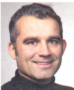
Von BEAT JANS Pro Natura, beat.jans@pronatura.ch

Alleine schon der Werdegang der Initiative der Zürcher FDP war ein Murks. Die Unterschriften kamen nur dank einem Budget von 1.3 Mio. Franken zustande. Von Beginn weg reagierten prominente FDP-Vertreter mit Konsternation. Im Frühjahr 2008 stritten dann die Initianten öffentlich über einen möglichen Rückzug der Initiative. Die Unumstösslichkeit von Parlaments- und Volksentscheiden, welche die Initiative durch die Abschaffung des Beschwerderechts der Umweltorgani-