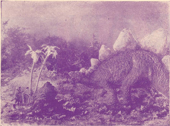
Une scène du „Monde perdu“