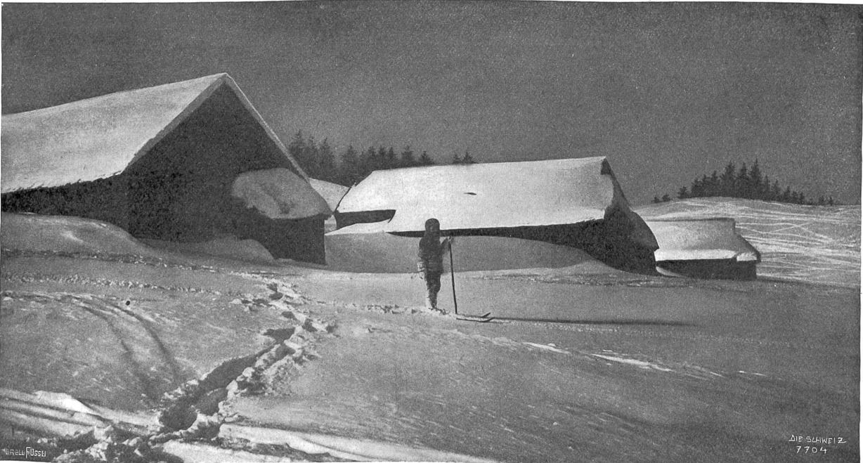
Winter-Idyll aus den Stanserbergen.