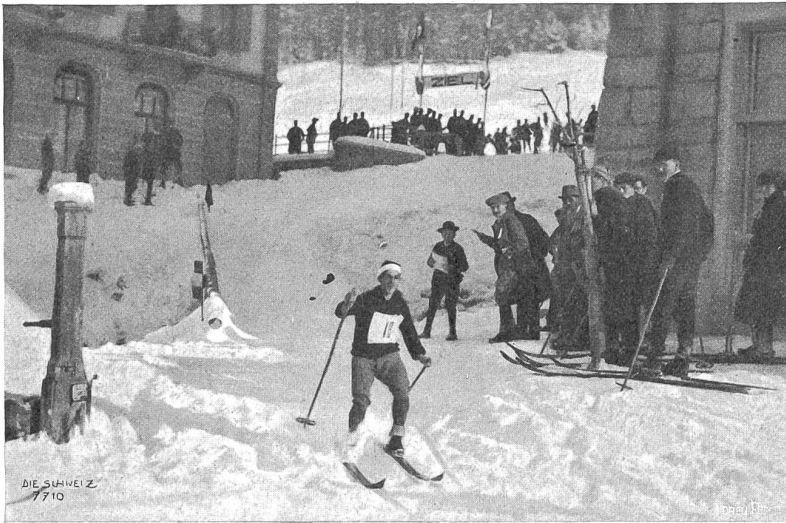
Schweiz. Skifest in Pontresina: Ein Läufer passiert im Langlauf Pontresina.

die Leute bei ca. 1300 m Höhendifferenz zur Diavolezza und Gernsfreiheit am Fuß des Piz Palü aufzusteigen, dann ging es abwärts zur Nola Persa über den Morteratschgletscher nach Pontresina zurück. Möglichst geschlossenes Antkommen der Patrouille am Ziel war zur günstigen Bewertung der Leistung eine der Hauptbedingungen.