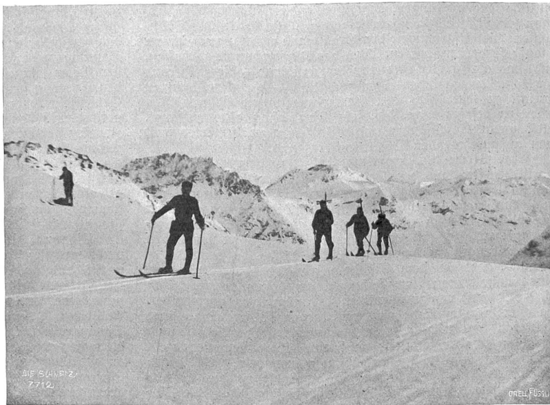
Schweiz. Skifess in Pontresina: Die Grindelwaldner Patrouille vor der Diavolezzahütte.

Allmendhubel, den Umbau der Linie Spiez-Frutigen usw. Musterhaft waren auch seine Flußkorrekturen, u. a. die Korrektur der Simme von St. Stenzen abwärts bis unterhalb Zweifimmen, die Randerkorrekturen in den Gemeinden Spiez und Wimmis; manchen Wildbach hat er gebändigt und neben Oberhofen manches Dorf mit Wasserversorgungen versehen. So ist seine Arbeit geradezu unübersehbar, und daneben fand er immer noch Zeit zur Verwaltung seiner vielen Liegenschaften und zur Mitarbeit in einer großen Zahl von öffentlichen und privaten Interessen dienenden Verwaltungen. Seine Mitbürger wählten ihn 1877 in den Berner Großen Rat, dem er von diesem Jahre an ununterbrochen angehörte.