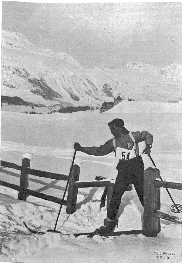
Schweiz. Skifest in Pontresina: Ein Junior beim Langlauf.