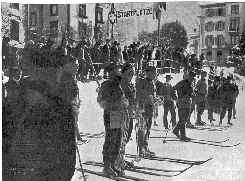
Schweiz. Skifess in Pontresina: Die siegreiche Patrouille von Grindelwald bei ihrer Ankunft in Pontresina.

Der sprechende Film „Kinetophon“. Edisons neueste Erfindung, das „Kinetophon“, wurde in den letzten Tagen des abgelaufenen Jahres zum ersten Mal in Deutschland gezeigt, und wenn auch die Erfindung noch nicht bis in die kleinsten Details perfekt ist, so ist doch vorauszu sehen, daß das sprechende Bild sehr rasch eine schwere Konkurrenz des stummen Films werden wird. Seit Jahren arbeitete Thomas Alva Edison an einem Zusammenwirken von Bild und Schall, ohne zunächst günstige Erfolge zu erzielen. Aber der Wundermann in Amerika hat nicht eher geruht, als bis er durch gewisse technische vervollkommnungen zu einem Resultat gelangte, das auch den Skeptischsten verblüffen muß. Man kann jetzt wirklich, melden