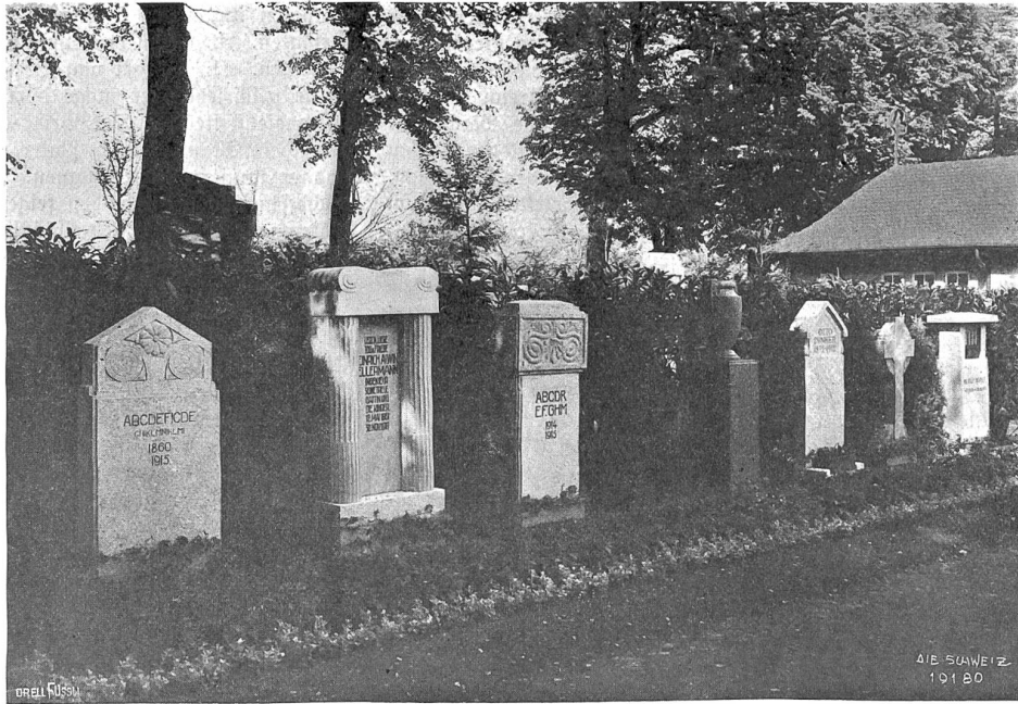
Friedhofskunst an der Schweiz, Landesausstellung. Der Mittelgang des Waldfriedhofs beim „Dörfli“ mit Grabsteinen der Firma A. Schuppisser, Zürich (Vertreter der Wiesbadener Gesellschaft für Grabmalkunst).

Krähenbühl sah seitwärts nach den Gesellen hin und kraute sich den roten Bart. Auf der Stirne zogen sich Falten zusammen. Er befand sich erst eine Zeit lang, ehe er antwortete.