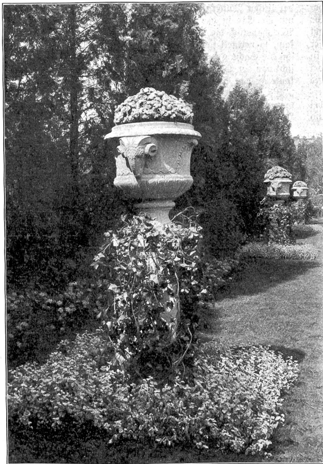
Gartenkunst. Dekorative Steinvasen. Eine Reihe grauer Steinvasen vor hoher Thujahecke sind mit dem zarten Blau des Ageratum geschmückt, während Efeu die Postamente berankt, die in einem Teppich von silbergrauem Gnaphalium stehen; aus dem Schatten leuchten die weinroten Dolben der Verbena tubikola. Nach Entwurf von G. Ammann ausgeführt von Ditto Froebel's Erben, Zürich.

Der brummte etwas Unverständliches in seinen roten Bart, worauf der Bauherr sagte, es sei jetzt das große Gitter um den Spielplatz zu machen oder etwa vierhundert Fensterbeschläge. Er könne die Arbeit mit dem Schlosser Guggler aus der Postgasse teilen. „Das heißt, wenn Ihr überhaupt wollt!“ fügte er schmunzelnd hinzu.