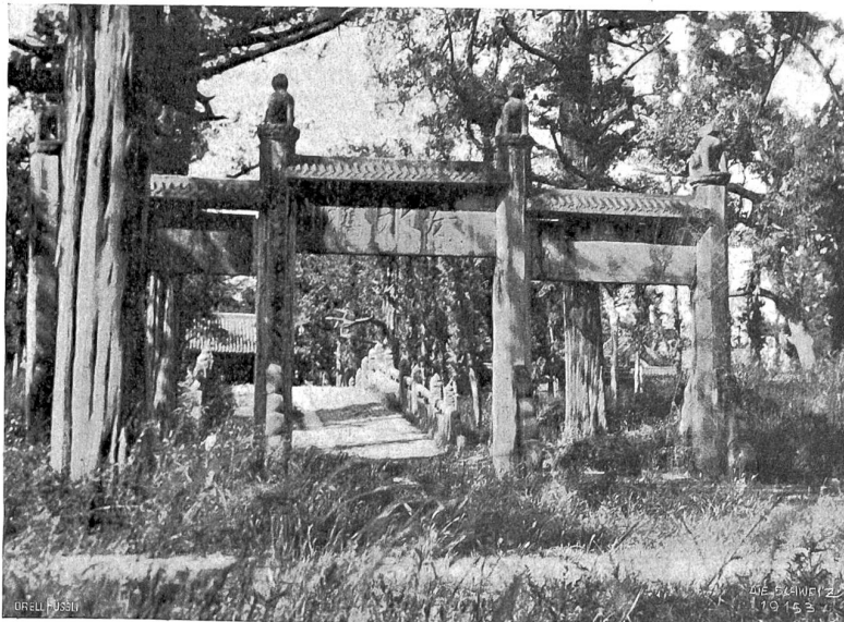
Chüfu Abb. 7. Ehrenbogen und weiße Marmorbrücke, die zur Grabstätte des Confucius führt.

Es ist erfreulich und verdient als Tat gebucht zu werden, daß es ein schweizerischer Verlag, das Art. Institut Drell Füsili, Zürich, wagte, in dieser bücherfargen Zeit gleich mit drei Publikationen des belletristischen Genres hervorzutreten, deren vor-