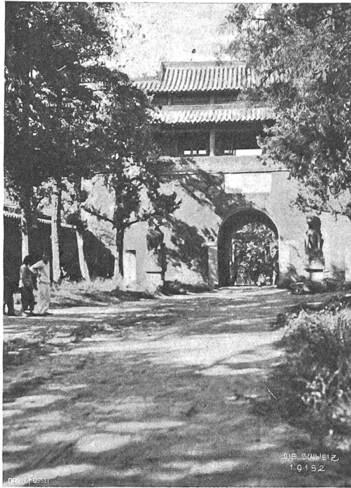
Chüfu Abb. 6. Der „heilige Weg“ (im Hintergrund das von feineren Löwen bewachte Tor).

an seinem Gott noch seiner Ueberzeugung irregeworden, da ihm dieses Pflichtgefühl das spät erscheinene Lebensglück abräubt. Denn unantastbar und unverrückbar steht in diesem Manne seine innere Welt, die er auf den Grundfesten der Pflichttreue und des Gottvertrauens sich selbst erschaffen und in sich verschlossen hat und aus der er seine beste Kraft und seine Freiheit schöpft; daß der Dichter uns erkennen läßt, wie es diese selbe innere Welt ist, in der Schuld und Tragik im Leben des Mannes wurzeln und wie er es uns zeigt, nämlich nicht durch hinweisende Worte, sondern durch das bloße Ereignis, das ist ein Meisterstück psychologischer Kunst, wie man es nur ganz selten einmal antrifft. Die stille, gehaltene Geschichte des Liberius, in der alles Heiße und Laute wie durch die Art des Helden so auch durch die Sprache des Dichters, die sich hier in ganzer durchsichtiger, manierloser Meisterschaft zeigt, gedämpft wird, steht in dem eben erschienenen Buche „Uralkes Lied!“*) zusammen mit vier andern Erzählungen, deren Schwer-