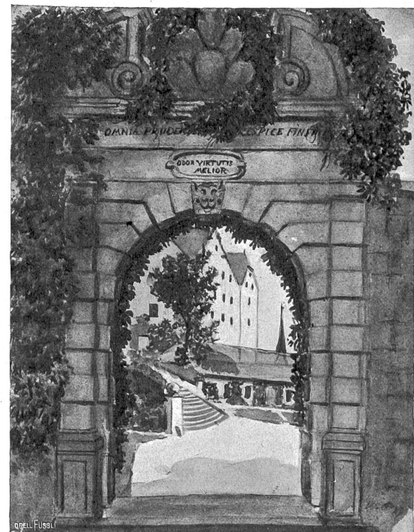
Barockportal auf Wildegg (mit Effingerwappen).

Grauerhangen der Morgen. Am Bahnhof ftehen Menschen gedrängt. In immer neuen Gruppen, von