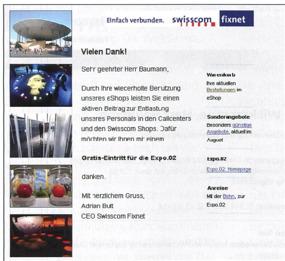
Bild 2. Unmittelbar nach dem Einkauf im E-Shop wird der Zielbenutzer (Person, die regelmässig im E-Shop einkauft) auf sein Kundengeschenk aufmerksam gemacht.