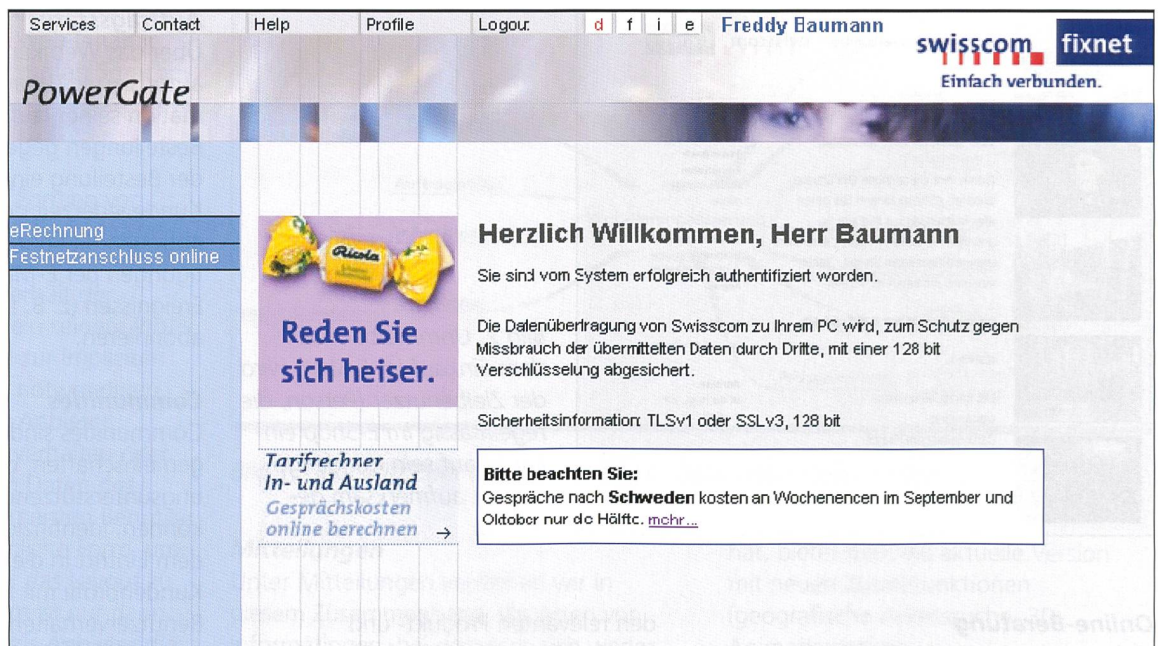
Bild 4. Beim Login zur «Festnetzrechnung online» erhält der Zielbenutzer (Person, die häufig nach Schweden telefoniert) eine Mitteilung über die Telefonaktion für Schweden eingeblendet.