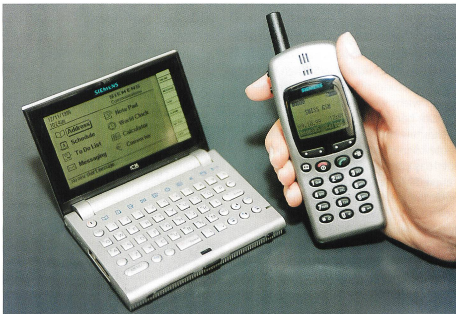
Bild 2. «IC35 – The Unifier», ein kleiner, mobiler Begleiter im Format eines Zigarettenetuis. Er ermöglicht in Verbindung mit einem Handy und eingebauter Infrarotschnittstelle das Verschicken von E-Mails, SMS-Nachrichten und Faxnachrichten.

allerdings drahtlos arbeiten. Da wäre zunächst der SIMpad (Bild 1) zu erwähnen, ein drahtloses Internetterminal mit Farbdisplay, mit dem man ohne langes Aufstarten und mit einfacher Bedienung auf das Internet gelangt. Die Dateneingabe erfolgt mit einem Stift über eine virtuelle Tastatur oder mittels Handschrifterkennung. Mit sechs Tasten können zudem die wichtigsten Funktionen des nur 24x18x2,5 cm grossen Gerätes gesteuert werden. Das Betriebssystem Windows CE® vereint den Internet-Explorer-CE-Browser, den Pocket-E-Mail-Client sowie weitere Anwendungen. Ein eingebautes Mikrofon und ein integrierter Lautsprecher sollen künftig sogar Voice-over-IP (VoIP) ermöglichen. In geschlossenen Räumen sorgt eine DECT-Schnittstelle für den Zugang zu einer Basisstation (etwa eine PABX) mit Zugang zu ISDN/POTS. Alternativ existiert noch eine ebenfalls drahtlose IEEE802.11-Schnittstelle, welche einen Highspeedzugang zu einem LAN ermöglicht. Doch auch unterwegs wird man mit dem SIMpad bedient, denn zu diesem Zweck steht noch eine GSM-Schnittstelle zur Verfügung. Wegen der langsamen Datenübermittlung bei GSM (ohne technische Tricks oder extra zu bezahlende Dienste wie HSCSD stehen bei GSM nur 9,6 kbit/s bereit) dürfte sich das mobile Surfen dann aber eher mühsam gestalten. Entsprechend dem zu erwartenden Trend