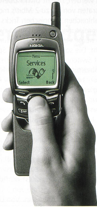
Bild 4. Seit November des letzten Jahres ist das Nokia-7110-WAP-Phone auf dem Markt. Es bietet Internettauglichkeit und weist ein grosses Display auf.

schränkungen der mobilen Endgeräte, beispielsweise ein kleines Display, beschränkter Energievorrat zur Stromversorgung, ein schmalbandiger und nicht immer stabiler Netzzugang, müssen die Informationen aus dem WWW so aufbereitet werden, dass sie vom Microbrowser im WAP-Handy interpretiert und in lesbarer Form dargestellt werden können. Es geht also nicht in jedem Fall darum, alle Inhalte aus dem WWW auf den kleinen Anzeigen in den Mobiltelefonen darzustellen. Vielmehr geht es primär darum, spezielle und auf die Möglichkeiten der WAP-Anwendungen abgestimmte WWW-Seiten über das Mobilfunknetz zu den Microbrowsern in den Endgeräten zu transportieren. Selbstverständlich wird dabei auf Informationen zugegriffen, welche in irgendeiner Form bereits im WWW vorhanden sind (z.B. Börsenkurse, Fahrpläne, Verzeichnisse usw.) und nur noch an die