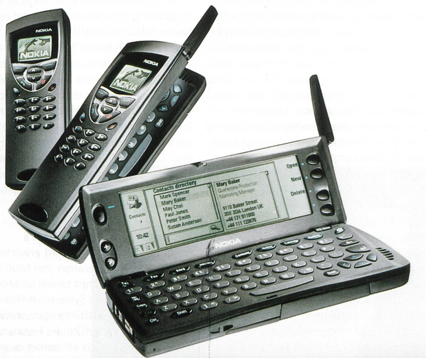
Bild 5. Der 9110-Communicator ist ein multifunktionell einsetzbares Gerät, das unter anderem auf dem Display Bewegtbilder von einer Digitalkamera anzeigt, die es über Infrarotschnittstellen via IR-TranP-Protocol aufnehmen kann.

zeigt, die an einen Notepad erinnert. Damit lassen sich E-Mails, SMS-Nachrichten und Faxe versenden und auch auf das Internet kann zugegriffen werden. Es lassen sich aber auch Grafiken senden, empfangen und ins Display holen. Über die Infrarotschnittstelle lassen sich die Daten an einen Laptop mit Windows NT oder Windows 95 überspielen. Über dieselbe Schnittstelle lassen sich zudem Bewegtbilder von einer Digitalkamera auf das Display des 9110-Communicators via IR-TranP-Protocol übertragen. Auch