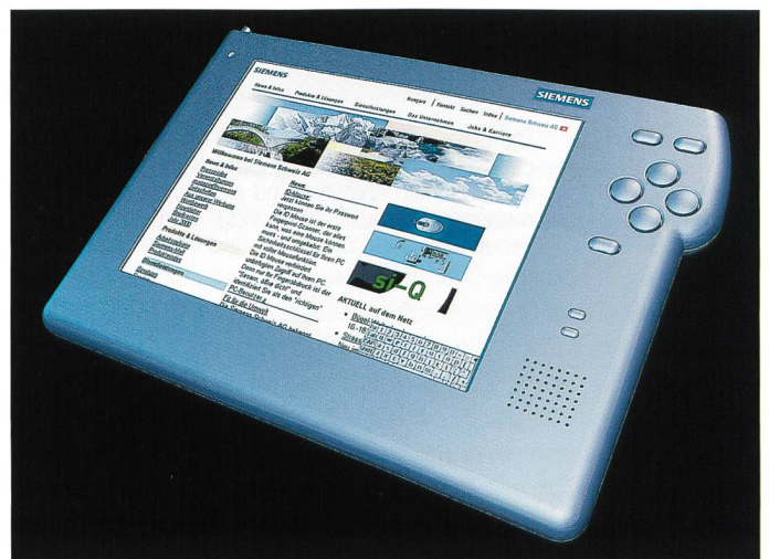
Bild 1. Der SIMpad von Siemens ist ein drahtloses Internetterminal mit Farbdisplay, mit dem man ohne langes Aufstarten und mit einfacher Bedienung ins Internet gelangt.

gut Deutsch Webtelefon. In den Web Appliances werden Telefon, Fax, Internet- und E-Mail-Station in einem Gerät zusammengeführt. Sie werden an das gewöhnliche Telefonnetz POTS (Plain Old Telephony System) oder ans ISDN angeschlossen. Neben dem Hörer und dem üblichen Tastenfeld für den Telefenteil verfügen derartige Endgeräte noch über einen berührungsempfindlichen Bildschirm (Touchscreen). Dort wird gleich nach dem Einstecken eine Auswahl von Dienstleistungen angezeigt. Diese brauchen einfach angetippt zu werden, und schon wird die entsprechende Webseite angezeigt. E-Mails sind in Windeseile geschrieben und per Antippen auf das entsprechende Feld im Bildschirm abgeschickt. Das umständliche Aufstarten und Einloggen am alten PC entfällt. Beim Nachhausekommen ist auf dem Display bereits ersichtlich, dass ein Mail eingetroffen ist: «You've got a mail». Das Nerven aufreibende Konfigurieren des PC entfällt und die Handhabung soll sich dank übersichtlicher Menüs spielerisch gestalten. Auch kostenmässig wird einiges versprochen: Die Webtelefone werden wohl bald für nur noch wenige hundert Franken erhältlich sein. Neben Alcatel wirbt auch die etwas innovativere Traditionsfirma Siemens um die Gunst der Käufer. An der Internet-Expo 2000 konnte der Besucher bereits zwei Exponenten der neusten Endgerätegeneration bestaunen, welche beide