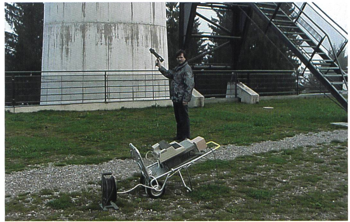
Bild 5. Spektrumanalysator zusammen mit tragbarer, handlicher Richtantenne.

die «Max-Hold»-Methode in Frage kommt. Bei jeder Art von Feldmessung im Innern von Räumen ist generell zu beachten, dass die Antenne während der Messung nicht in die Nähe von Gegenständen gelangt oder diese sogar berührt. Die Antenneneigenschaften werden nämlich