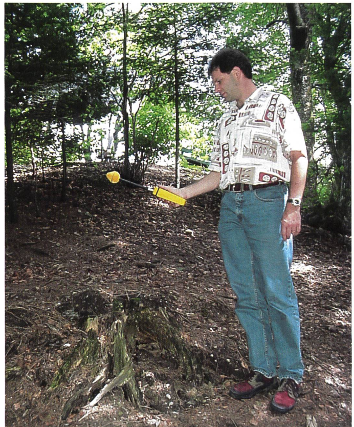
Bild 4. Tragbares Messgerät mit isotrop wirkender Antenne.

Bei den angezeigten Werten handelt es sich somit um den gemessenen Maximalwert und damit um einen worst case bezüglich EMUV. Dies bedeutet eine zusätzliche massive Verschärfung der erlaubten Immissionen, da die Grenzwerte (Vorsorgewerte) für eine homogene Exposition des ganzen Körpers definiert sind und nicht für einen lokalen Spitzenwert der Feldstärke. Diese Frage und weitere Zusammenhänge über die Messung und Beurteilung von Immissionen weit unterhalb der Grenzwerte muss in einem separaten Bericht grundsätzlich diskutiert werden. Die «Max-Hold»-Methode liefert reproduzierbare Werte. Es können damit beispielsweise auch Gebäudedämpfungen reproduzierbar bestimmt werden. So kann man beispielsweise feststellen, dass wärmeisolierendes Fensterglas die Feldstärke ohne weiteres um einen Faktor 20 und mehr abschwächt. Solche Erkenntnisse gewinnt man am einfachsten in der Praxis. Eine Simulation im Labor wäre zu aufwändig.