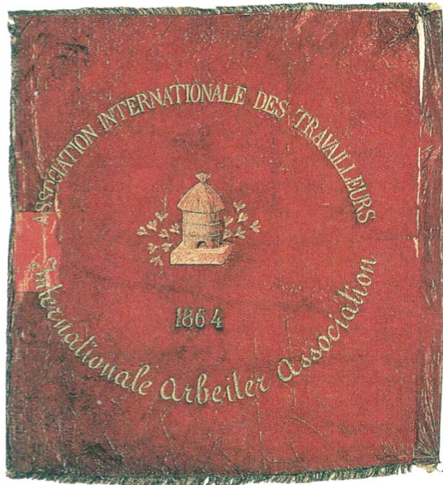
Drapeau de la section genevoise de l'Association internationale des travailleurs, 1868 (revers).

ci-dessus, ajoutons-y quelques éléments descriptifs sur son état actuel ainsi qu'un rapide aperçu de son histoire ultérieure. Il mesure 168 cm le long de la hampe et 150 cm perpendiculairement; les franges de 35 mm, rosadées et dorées sont en plus. En 1966, l'expert du Musée d'art et d'histoire où il a été déposé, écrivait :