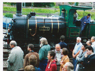
Una meca para los amantes del ferrocarril.