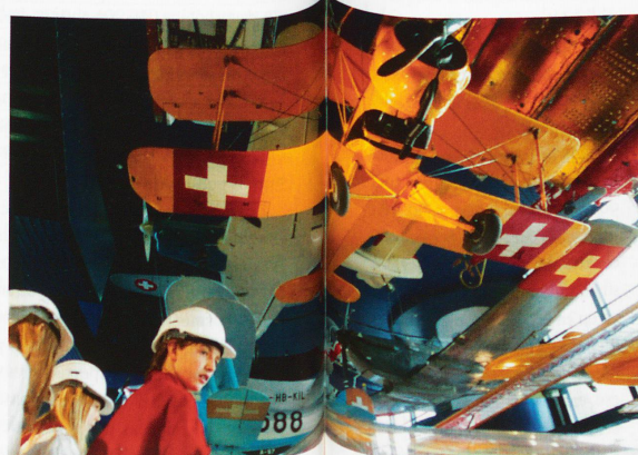
La historia de la aviación.