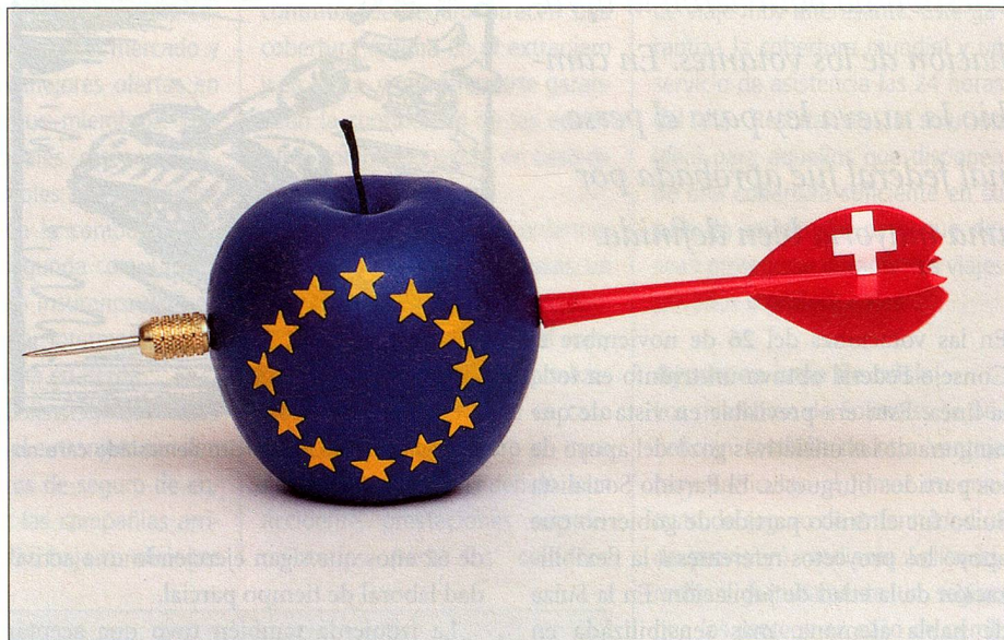
Los elementos mitológicos serán presentes también durante la campaña de votaciones sobre la relación entre Suiza y la UE.

Para presentar esta iniciativa popular en la relación correcta, hay que recordar los momentos decisivos de la política europea de Suiza. Mayo de 1992: El Consejo Federal solicita el inicio de las negociaciones destinadas a ingresar a la UE. 6 de diciembre de 1992: En una votación federal el pueblo rechaza el ingreso de Suiza al Espacio Económico Europeo (EEE). Como consecuencia, el Consejo Federal congela la solicitud, pero establece como «meta estratégica» de su política europea el ingreso completo de Suiza a la Unión Europea y desea deliberar en Bruselas sobre la ampliación del Acuerdo de