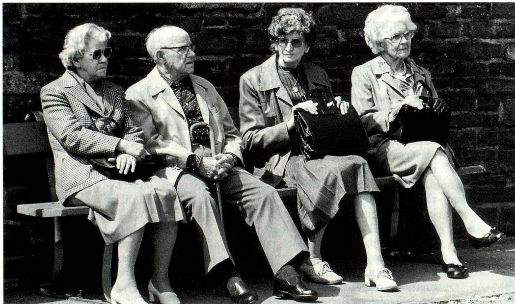
Aún tienen segura su renta de vejez. ¿Pero la tendrán también en el año 2010?

Actualmente, los hombres se jubilan a los 65 años de edad y según la 10ª revisión del AVS que aceptamos hace algunos años, la edad de jubilación de las mujeres subirá de 62 a 64 años (a partir del año 2005). Se está analizando también si es factible modificar las rentas, v.g. aumentar las rentas mínimas, disminuir las máximas, combinar las dos variantes y ajustar más o menos rápidamente las rentas al aumento del costo de vida. Cualesquiera ajustes que se le hagan a la 1ª columna (AVS/AI) podrían conllevar ajustes a la 2ª (cajas de pensión) tales como mejorar los beneficios para quienes devengan salarios bajos y