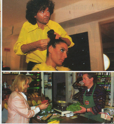
Las empresas pequeñas y medianas son la base de la economía suiza tanto en la industria como en el campo de los servicios.