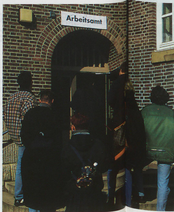
Jóvenes frente a la oficina de desempleo. Para la juventud el desempleo y la falta de puestos de aprendizaje son problemas apremiantes.

No obstante, estos incentivos son poco factibles en vista del ambiente bastante depresivo que se registra en las economías europeas. Durante el invierno pasado el cambio del franco siguió siendo demasiado alto y no bajó a un nivel normal sino en primavera. La exportación de empresas y puestos de trabajo al extranjero siguió desenfrenadamente, en parte debido a los costos y en parte porque Suiza no está integrada en la Unión Europea. A largo plazo, también es alarmante la merma masiva del mercado laboral en Alemania, porque Suiza