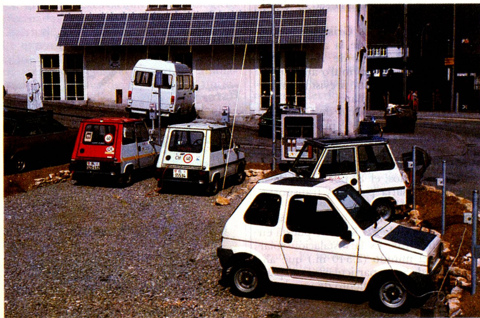
Los automóviles eléctricos cargan «sol» en Liestal.

«Actualmente la situación es casi inversa: