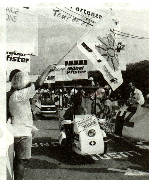
La carrera de automóviles solares «Vuelta del Sol», obra de pioneros de la energía solar en Suiza. (Foto: «Vuelta del Sol»).

● Ya el año pasado, una instalación solar de una potencia de 2,5 KW fue puesta en servicio en Titlis . Es la instalación solar más alta del mundo (2.540 m.) que alimenta la red. Sirve particularmente para estudiar el comportamiento de instalaciones solares en condiciones atmosféricas extremas.