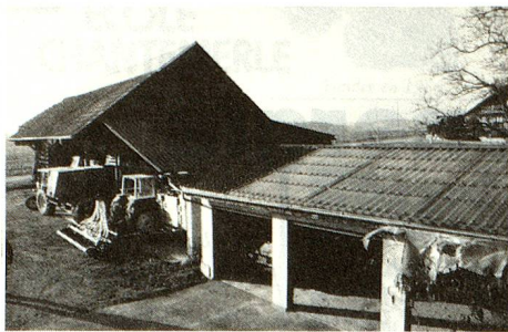
Utilización de la energía solar en la agricultura.