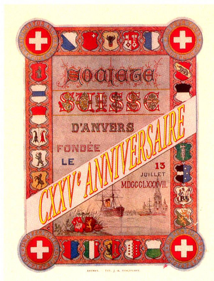
Carte postale spécialement créée pour le 25 e anniversaire de la Société suisse d'Anvers (1912)