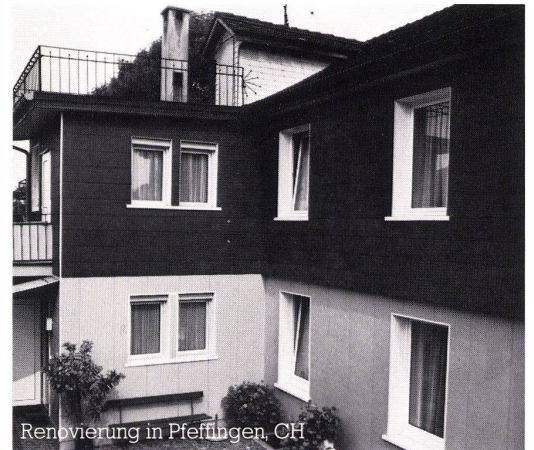
Renovierung in Pfeffingen, CH