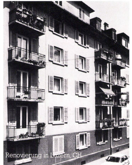
Renovierung in Luzern, CH