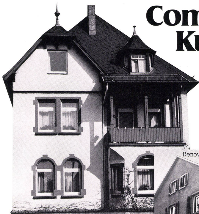
Renovierung in Winterthur, CH