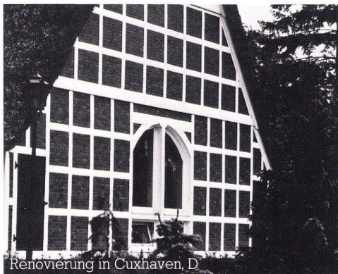
Renovierung in Cuxhaven, D