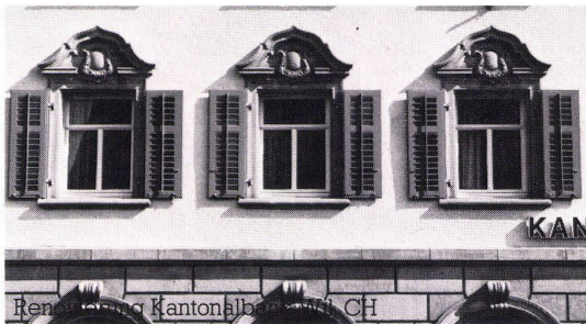
Renovierung Kanton Basel, CH