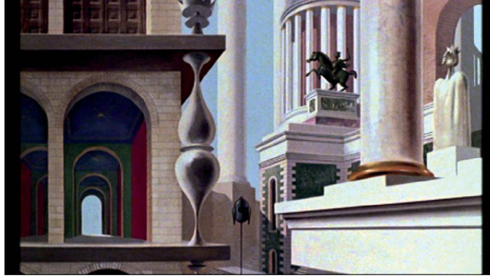
De gauche à droite : Aldo Rossi, La Città Analoga 1976 / Paul Grimault, Le Roi et l'Oiseau , 1979