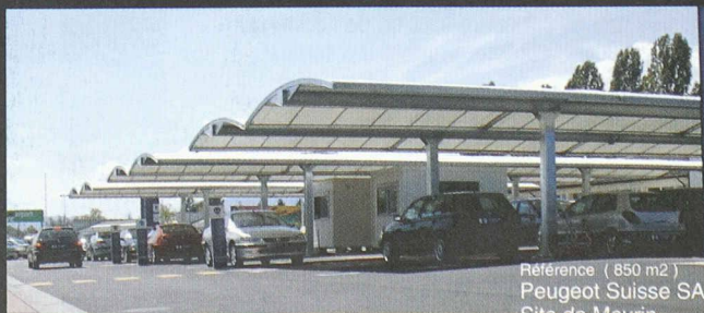
Référence ( 850 m2 ) Peugeot Suisse SA Site de Meyrin