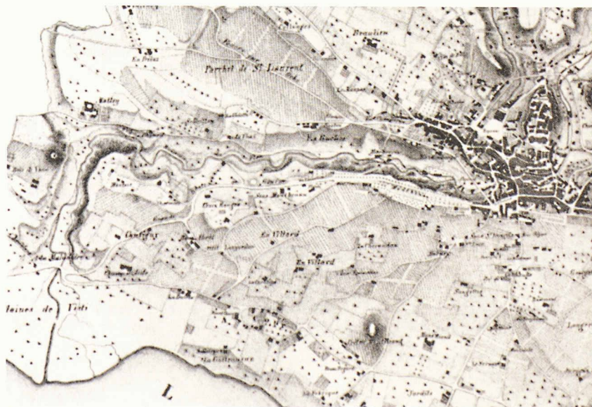
Carte de Lausanne et de ses environs (vue partielle), 1838 (Document MAH, La ville de Lausanne, Tome 1)