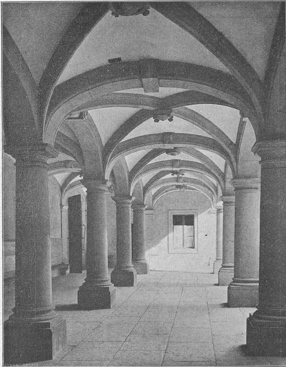
Cliché de « La Maison de Ville de Genève ». — A. Jullien, éditeur.

La rampe fait le tour d'un noyau de plan carré, très