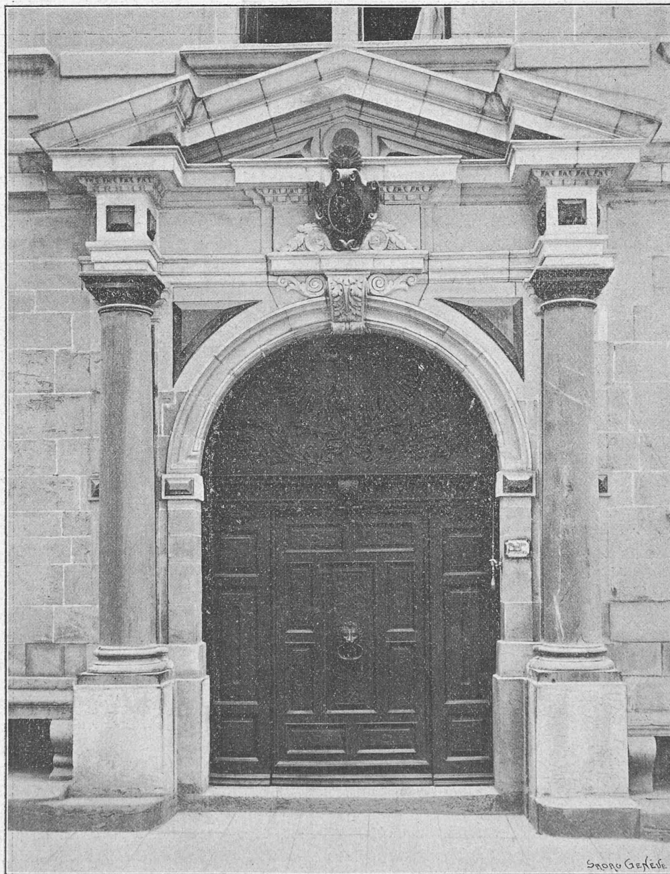
Cliché de « La Maison de Ville de Genève ». — A. Jullien, éditeur.

les différentes maisons constituant alors l'édifice communal. Chacune de ses faces présentait deux rangs superposés de larges arcades, quatre à chaque étage, suivant la pente de la rampe. A l'étage supérieur huit petites ouvertures éclairaient de chaque côté l'intérieur. Aucune mou-