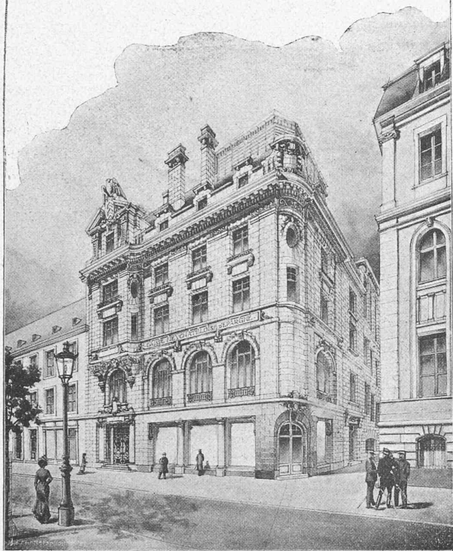
Façade sur la rue Léopold Robert. — IV e prix : Projet « Vert et fleuri ». — vier, qui recouvre une couche imperméable d'argile et de marne.

Les captations d'eau qui ont été faites, ont fourni un débit de 190 litres par minute, dont seulement le \frac{1}{10} est utilisé par suite de l'emploi d'une batterie de trois béliers qui élèvent l'eau sur le plateau. Pour le moment cette quantité d'eau est suffisante. Si plus tard on veut utiliser toute l'eau, on aura recours à une pompe actionnée électriquement, comme il en existe déjà plusieurs dans le canton.