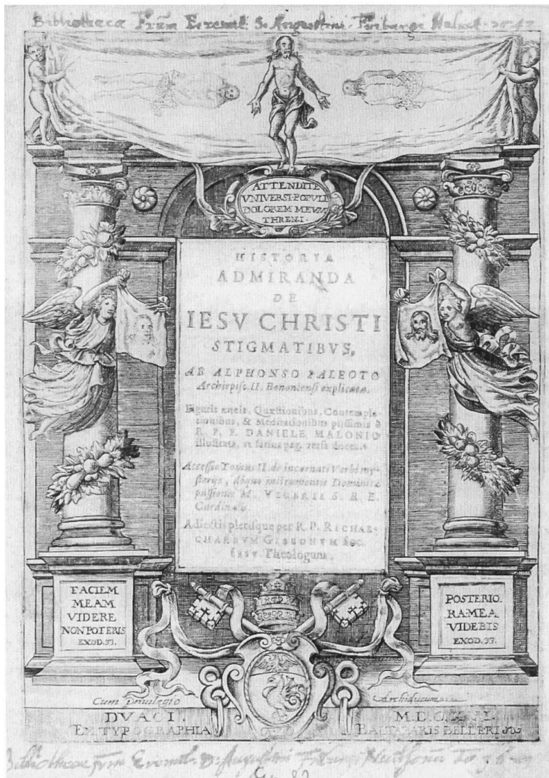
Ill. 5. Alfonso Paleotti, Historia admiranda , Baldassarre Belleri, 1616.

Di questo volumetto ci interessa il frontespizio (ill. 5), perché propone, nell'ambito della rappresentazione del Volto santo, una esplicita e rara messa in relazione tra il tipo di ritratto impresso e quello espresso , a cui si aggiunge l'importante raffigurazione della Sindone. La triade in questione ci offre l'occasione di approfondire, nel contesto del pensiero dell'epoca, il senso del paradosso del Volto espresso di Serodine.