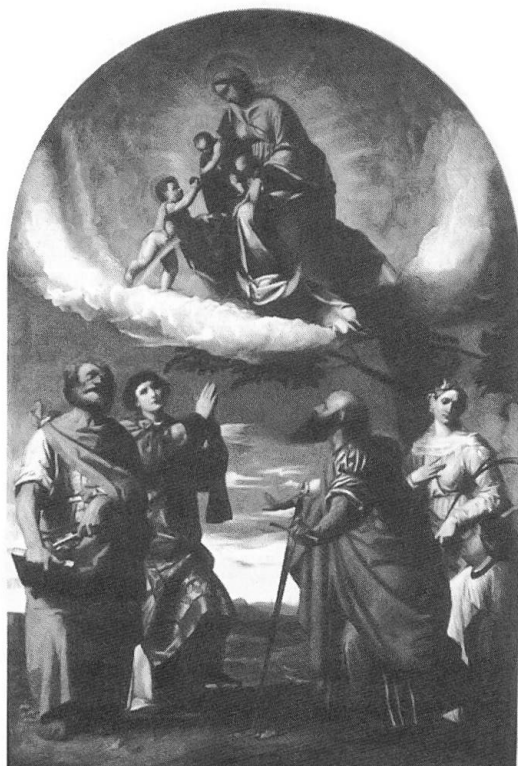
Ill. 6. Moretto, Madonna in gloria col bambino e San Giovanni Battista fanciullo, e i santi Pietro, Lorenzo, Caterina d'Alessandria, Paolo e un donatore , anche detta Madonna della noce , 1525, Manerbio, chiesa parrocchiale di San Lorenzo.

Madonna della quercia attribuita a un pittore fiorentino del XVI secolo (ill. 7) 29 . A Santa Maria delle Grazie a Ronco sopra Ascona, è collocata La pala della Madonna della quercia in gloria 30 .