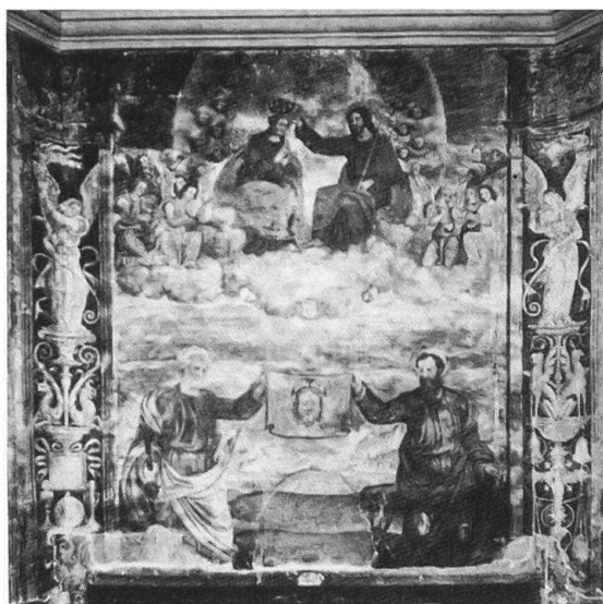
Ill. 2. Scuola luinesca, Incoronazione della Vergine , Ascona, Chiesa parrocchiale Santi Pietro e Paolo.

Borromeo e Sebastiano, con l'aggiunta, sullo sfondo, di alcuni tronchi d'albero. Con le figure dei santi e dei tronchi, Serodine innesta una serie di elementi essenziali per la creazione di un'unità all'interno dell'opera: se infatti i due registri sovrapposti non presentano, pur restando distinti, una cesura netta, come invece accade nell'affresco, è grazie, lo vedremo, proprio alla messa in gioco di questi nuovi elementi. Gli stessi, perché investiti di un ruolo primario, sono inoltre portatori di unità anche a livello di significato.