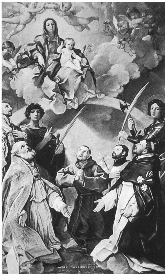
Ill. 8. Guido Reni, Madonna con il bambino in gloria e santi patroni di Bologna , 1630 circa, Bologna, Pinacoteca Nazionale.

La posizione e la gestualità di sant'Antonio sono peraltro iconograficamente quelle del santo che intercede per una popolazione. Il punto in cui egli è figurato è importante: a sinistra, dove comincia la lettura del quadro. Lì, in basso, c'è la sua grande mano destra aperta verso lo spettatore e lì, le sue braccia si aprono verso il basso in un gesto implorante la misericordia divina. In un dipinto di Guido Reni la gestualità del santo protettore di Bologna è identica a quella di sant'Antonio. San Petronio mostra chiaramente per chi sta intercedendo: il riferimento alla popolazione è segnalato dalla veduta della città, sulla quale il santo apre le braccia (ill. 8).