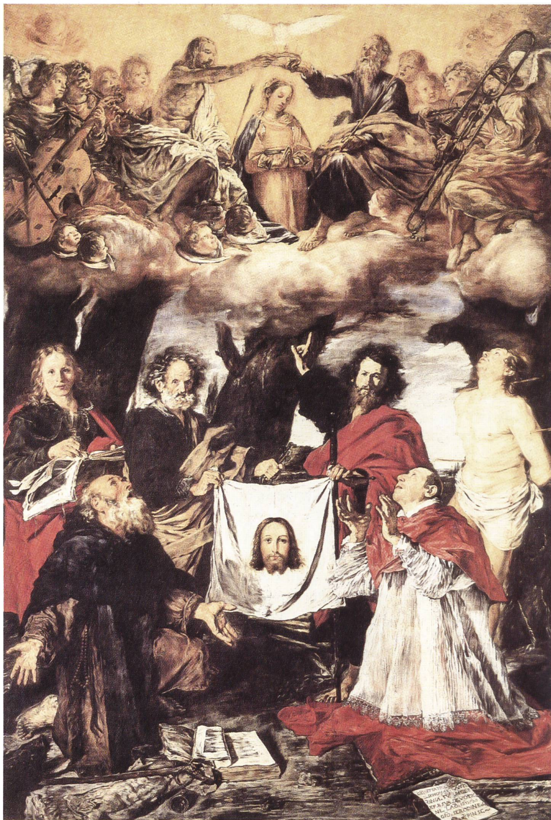
Ill. 1. Giovanni Serodine, Incoronazione della Vergine , 1630 circa, Ascona, Chiesa parrocchiale Santi Pietro e Paolo.