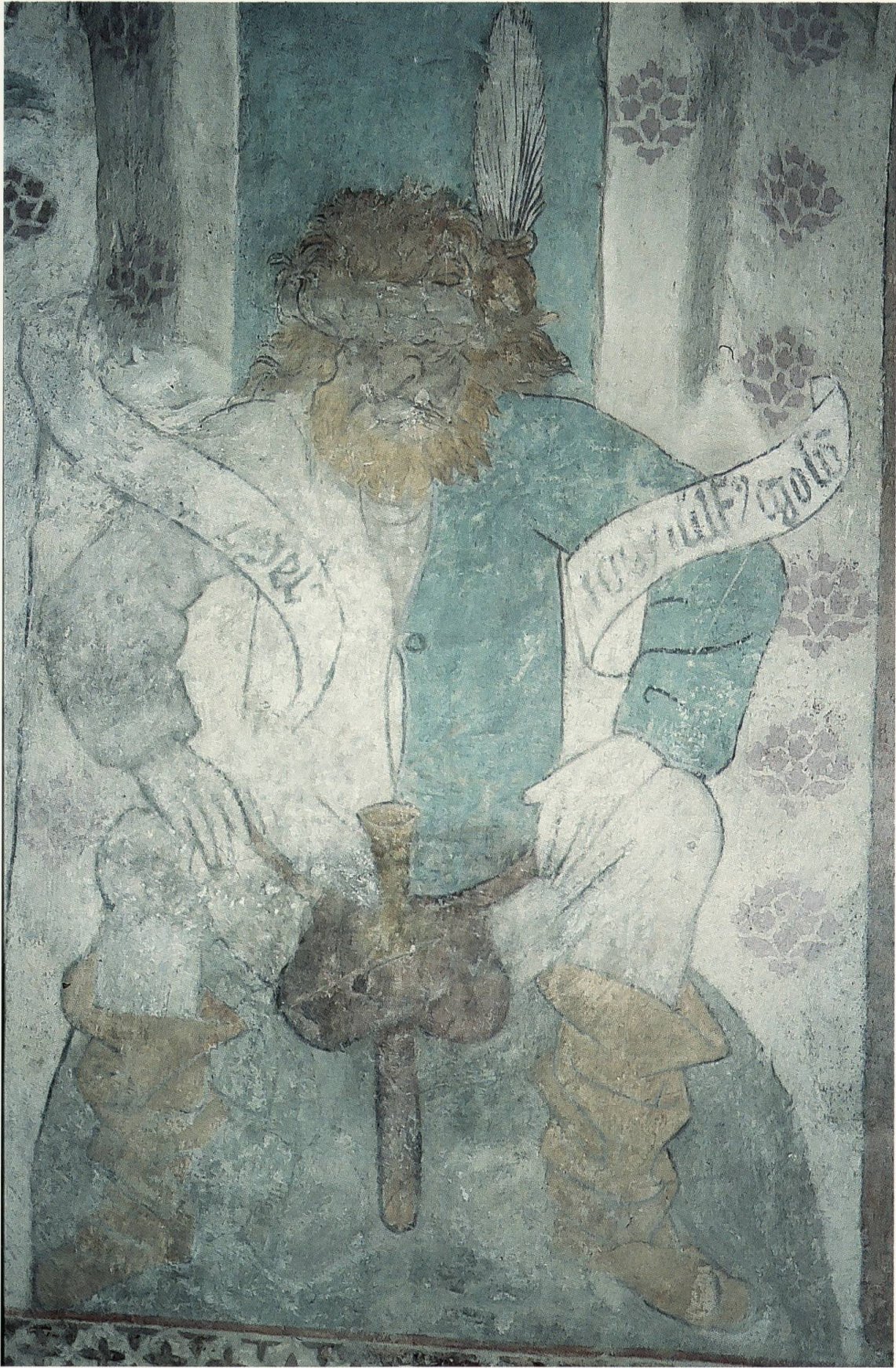
Abb. 1: Markolf