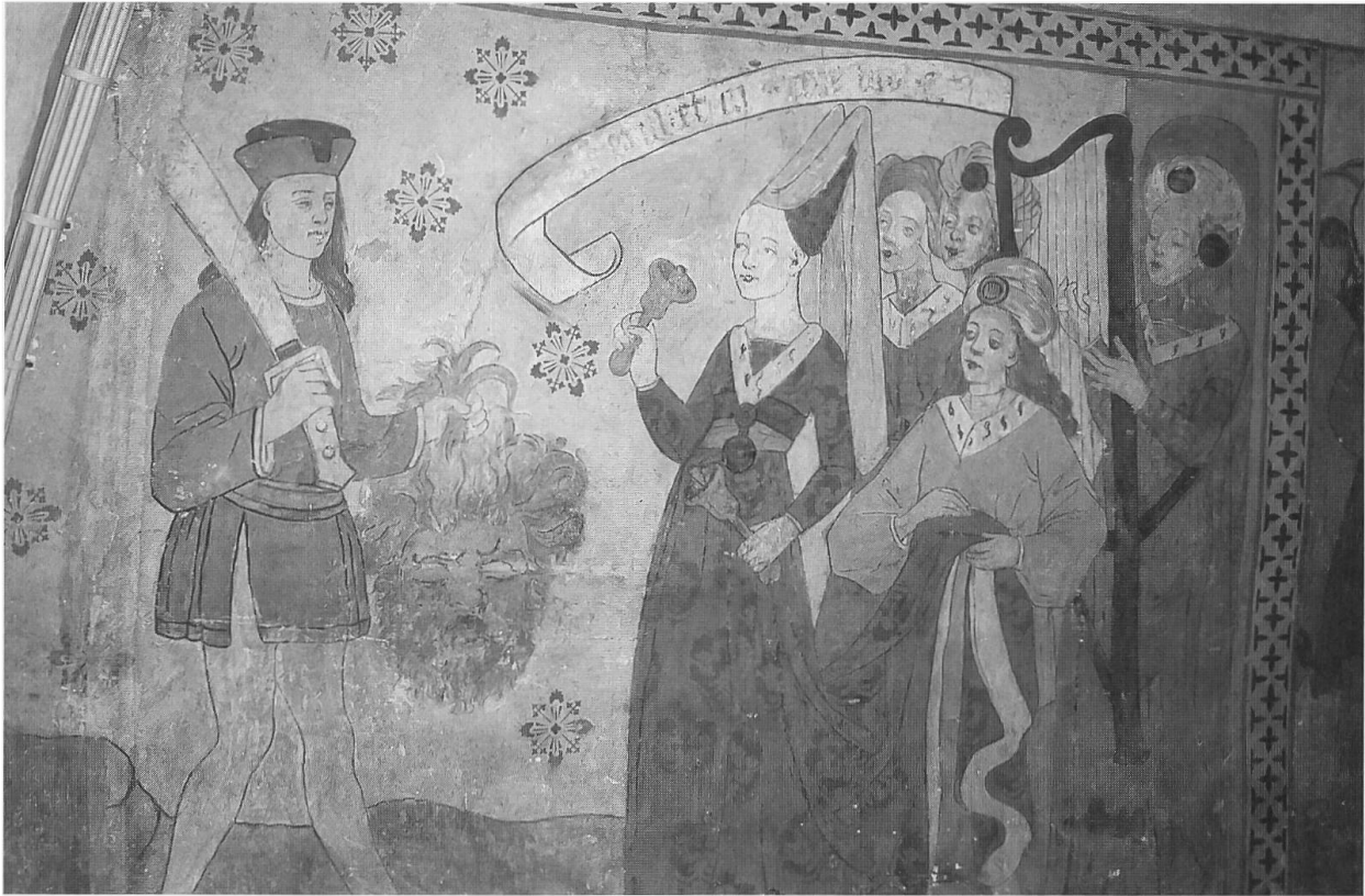
Abb. 3: David kehrt mit Goliaths Kopf zurück