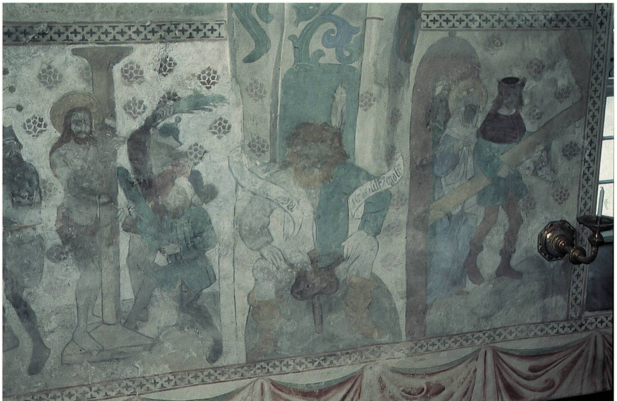
Abb. 4: Jesus an der Martersäule, Markolf, die Kreuztragung des Simon von Kyrene