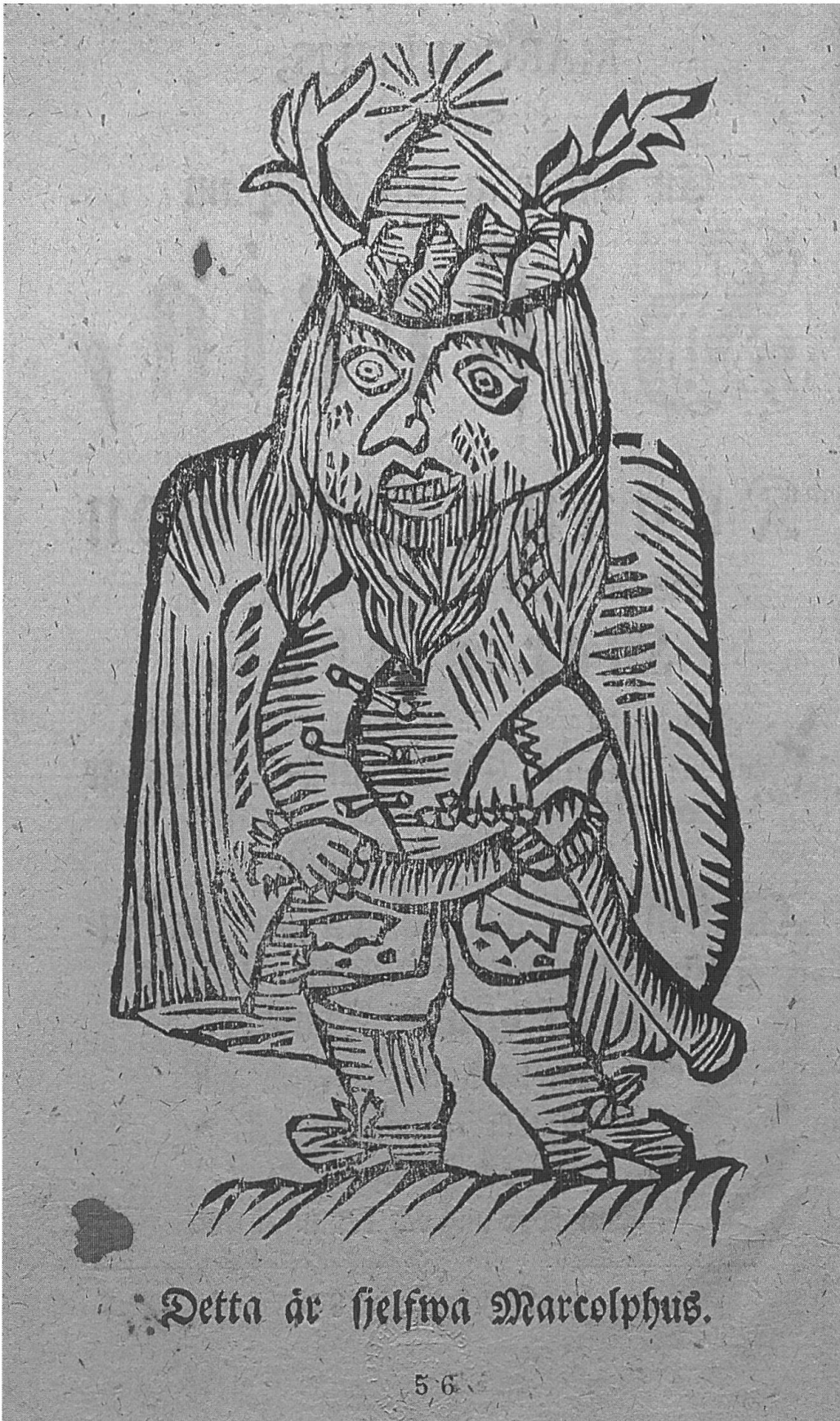
Abb. II: Marcolphus von 1784: Holzschnitt nach dem Titelblatt