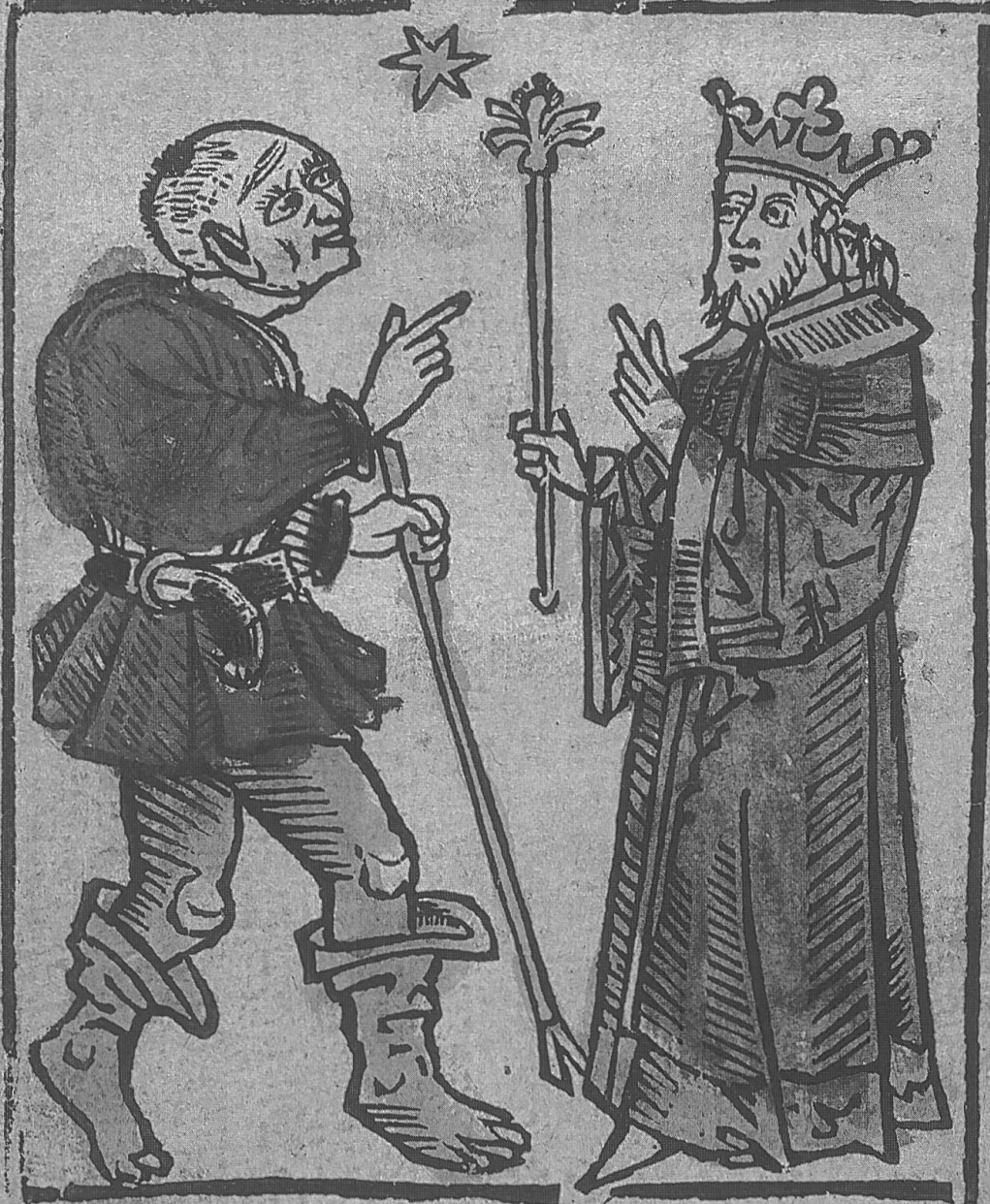
Abb. 6: Titelblatt der Collationes [Leipzig, K. Kachelofen, o.J.]: Markolf als kahler stultus vor König Salomon. Ex.: Uppsala KUB

I ncipiunt collatiōes quas dicuntur fecisse mutuo Rex salomon sapientissimus et Marcolphus facie deformis et turpissimus tamen ut fertur eloquentissimus feliciter