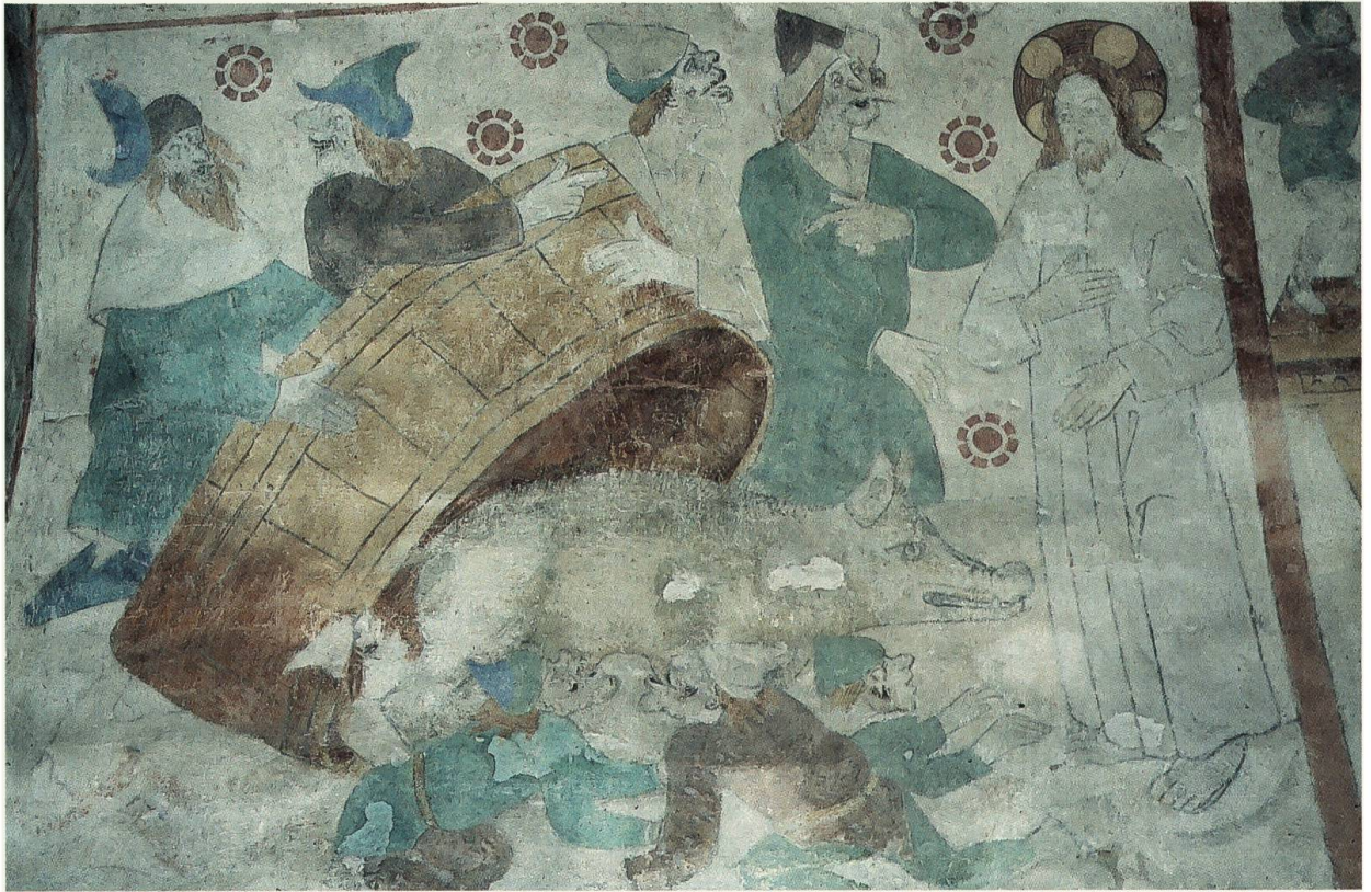
Abb. 12: Die Judensau