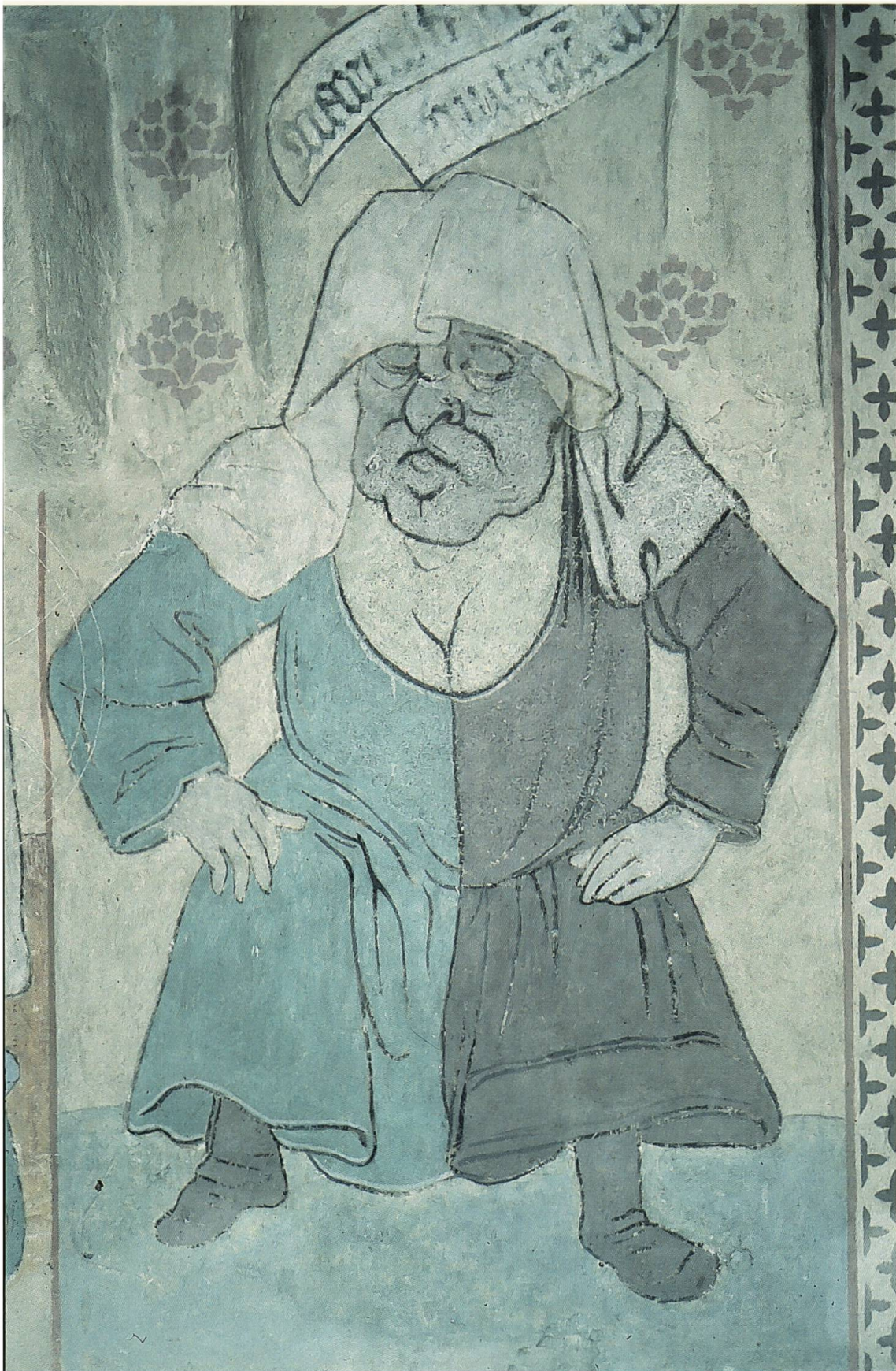
Abb. 5: Markolfs Frau