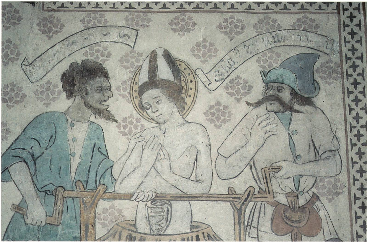
Abb. 9: Das Martyrium des Hl. Erasmus