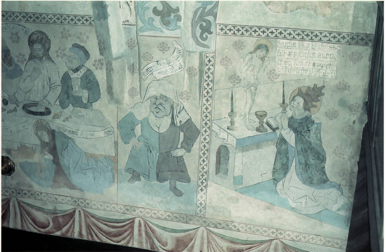
Abb. 8: Jesus empfängt eine Sünderin im Haus des Pharisäers Simon, Markolfs Frau, Gregoriusmesse mit Ablaßinschrift