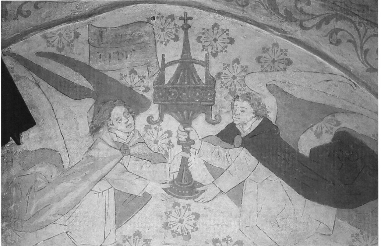
Abb. 2: Zwei Engel mit einem Ziborium und der Signatur Meister Alberts