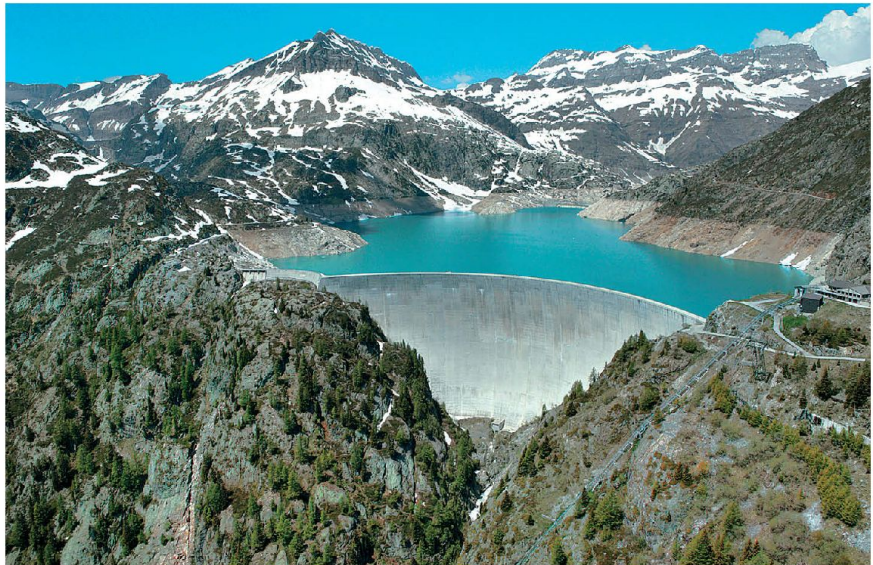
Welche strategische Bedeutung werden die Schweizer Pumpspeicherkraftwerke künftig im europäischen Rahmen haben?

Diese Strategie, auf welcher die Energiepolitik der letzten Jahre ausgerichtet war, erfuhr am 25. Mai 2011 eine unerwartete Neuausrichtung. Der Bundesrat hat unter dem Einfluss der Ereignisse von Fukushima und massivem Druck aus dem Parlament eine neue Energiepolitik formuliert.