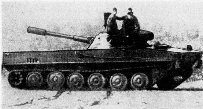
Bild 1. Spähpanzer PT 76

Seit etwa 1956 ist der schwimmfähige Spähpanzer PT 76 bei den russischen Aufklärungstruppen eingeführt. Gewicht zirka 16 Tonnen. Dieselmotor 300–350 PS. Straßengeschwindigkeit zirka 50 km/h. Wassergeschwindigkeit 8–10 km/h. Bewaffnung: Eine 76,2-mm-Kanone L48 (es besteht eine Version mit einer kürzeren 85-mm-Kanone), ein koaxiales Maschinengewehr.