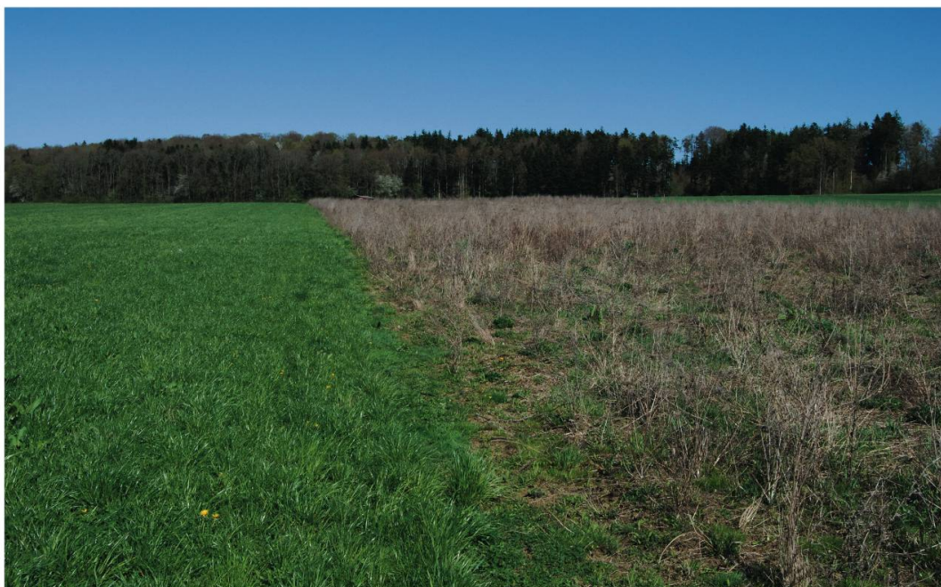
Fig. 1 : Jachère florale située au sud des étangs de Dampfreux JU, site d'escale de la Bécassine double, le 7 avril 2011.