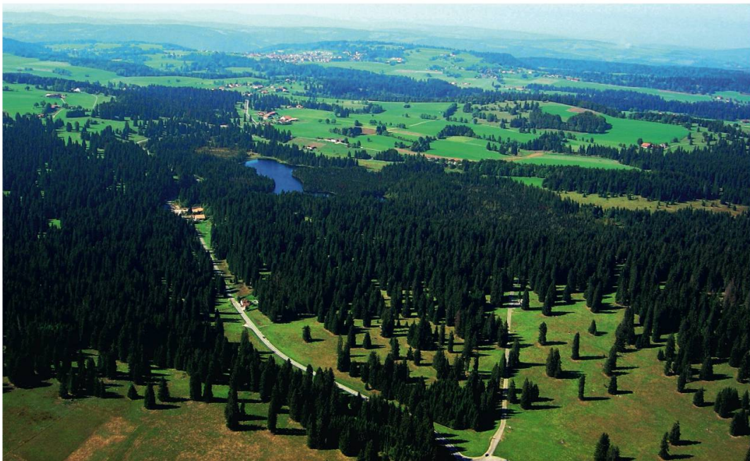
Ill. 1. Vue aérienne du pâturage boisé au sud de l'Etang de la Gruère.

Complexe, le pâturage boisé l'est aussi de par les multiples utilisations dont il fait aujourd'hui l'objet. S'il est le fruit d'une tradition séculaire d'utilisation mixte, pastorale par le pacage des troupeaux et sylvicole par la récolte des bois, sa signification actuelle va bien au-delà du rôle toujours important qu'il joue encore dans l'économie rurale des régions qu'il occupe. Avec l'avènement de la société de loisirs demandeuse de grands espaces de détente et l'intérêt public croissant pour la préservation des paysages ruraux traditionnels, le pâturage boisé se trouve aujourd'hui au carrefour de nombreuses attentes souvent difficilement conciliables.