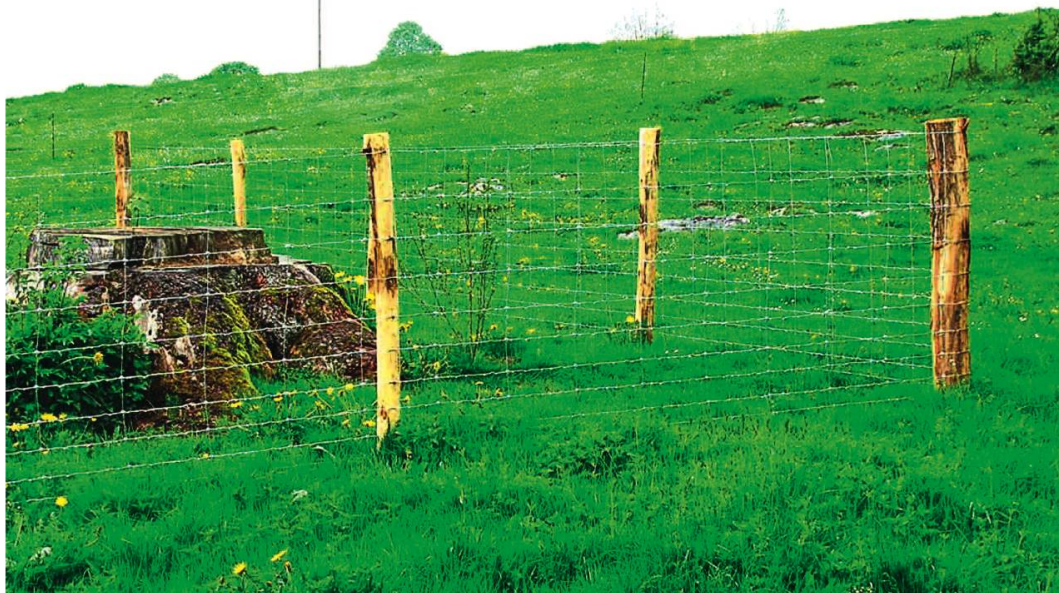
Ill. 3. Ilot de rajeunissement forestier sur le pâturage communal de La Chaux-des-Breuleux.

La promotion des énergies renouvelables et en particulier du bois-énergie laisse pour sa part entrevoir de nouvelles solutions pour la récolte de bois sur pâturage boisé, en offrant de nouveaux débouchés aux assortiments jusqu'ici peu valorisés, telles les branches et les cimes. Une récente étude réalisée dans les Montagnes neuchâteloises 6 parvient à la conclusion que les pâturages boisés de cette région pourraient fournir annuellement 7300 m 3 de plaquettes, ce qui équivaut à environ 2350 MWh ou 235 000 litres de mazout, et ce sans exploiter davantage de bois qu'aujourd'hui.