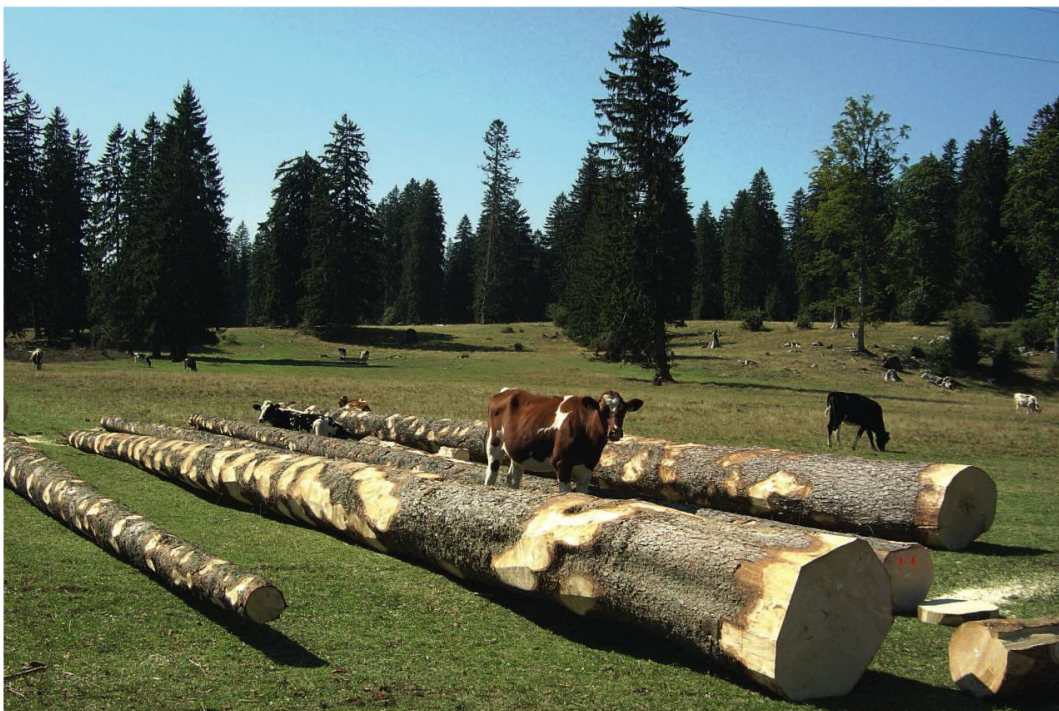
Ill. 2. Grumes noueuses fraîchement abattues sur le pâturage communal des Genevez.

Le bois produit dans les pâturages communaux francs-montagnards fait lui aussi l'objet d'une récolte régulière, dont le volume annuel reste toutefois difficile à chiffrer en l'absence d'une statistique détaillée des exploitations. Une récente étude commandée par l'Office de l'environnement du Canton du Jura 2 montre cependant que le potentiel durable d'exploitation de bois dans les pâturages boisés jurassiens pourrait se situer entre 15000 et 20000 m 3 de bois par an.