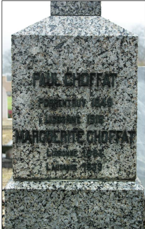
Fig. 3. Inscription sur la tombe de Paul Choffat (socle de la croix).