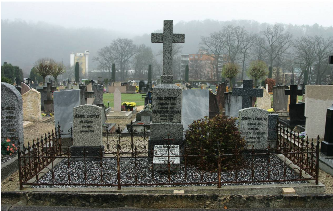
Fig. 2. Tombe de la famille de Paul Choffat 1 au cimetière « En Solier » de Porrentruy.

Léon Paul Choffat est décédé au Portugal en 1919. Il a tenu à être enterré en terre jurassienne : il repose à Porrentruy, « en Solier » (Fig. 2 et 3).