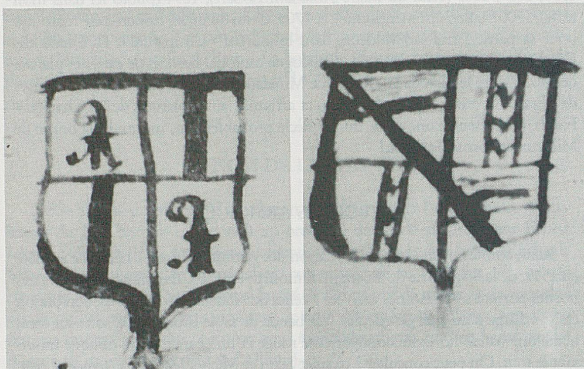
Fig. 2 - Armoiries qui étaient marquées sur les bornes de 1538 : à gauche de l'Evêché, à droite de Challant-Neuchâtel. Dessins datant de 1695. (Photo de l'auteur).

d'Abraham Robert montre que la troisième borne depuis le Roc Mildeux est celle des « Reprises », lieu-dit situé à l'est des Petites Crosettes de La Chaux-de-Fonds, et O. Clottu donne à la page 45, le dessin d'une borne située aux « Reprises », portant précisément le blason de Challant-Neuchâtel sur une face (comme décrit ci-dessus), et celui placé sur l'autre face, qui est de l'évêque de Bâle Philippe de Gundelsheim. Ce dernier portait « de gueules au pal d'argent », donc une bande verticale blanche sur fond rouge.