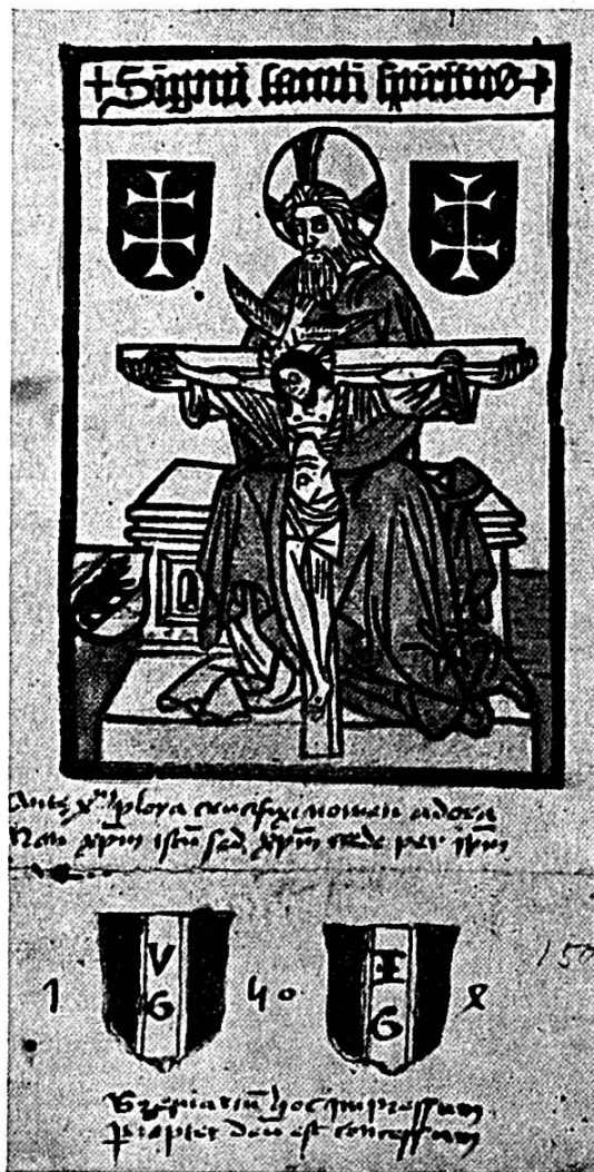
Fig. 2. Ex-libris de Guillaume et Jean Grimaître sur vignettes de l'Hôpital du Saint-Esprit de Berne et ex-libris manuscrit de Guillaume Jehan Grimaître, 1504.

s'ouvrait sur la face nord de la nef de la Blanche église. L'autel était desservi par un chapelain dont la désignation appartient à la famille Lescureux puis à son héritier (Claude Symonin). Le premier chapelain nous est connu : « Messire Guillaume de Filax, venu de Saint-Ursanne, un clerc, devint prêtre, à qui Jehan Lesquereulx donna sa chapelle 11 ». Il s'agit de Guillaume Grimaître, curé de Fenis dès 1464, qui a constitué une collection remarquable d'ouvrages religieux, incunables et manuscrits, portant son ex-libris (Fig. 2), en majorité conservés aux archives de La Neuveville. Il meurt en 1519 après environ 70 ans de ministère et est enseveli dans la chapelle du Saint-Esprit. Sa pierre tombale armoriée se trouve encore à la Blanche église, seul témoin survivant de la chapelle détruite. Guillaume Grimaître a participé à tous les actes importants des Lescureux, père, fils et alliés ; il a assisté à leurs testaments de 1447 à 1518 ! Messire Guillaume Audet, d'Yverdon, lui succède comme recteur perpétuel de la chapelle du Saint-Esprit ; il est collateur désigné de la chapelle Notre-Dame-de-la-Combe fondée en 1520. Il paraît être le dernier chapelain officiant avant la Réforme.