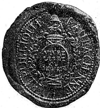
* Sceau de la République rauracienne

En janvier 1793, le 26, Goetschy est nommé député de la ville par quarante voix. Mais par suite d'une formalité que nous ne nous expliquons pas, il tire au sort avec Jacques Collon. Quelques jours plus tard, il demandait comme imprimeur national un bon de l'Assemblée pour toucher un acompte sur ce qui lui était dû; on le lui accorda. Enfin, nous lisons dans le registre des délibérations 1) : « L'imprimeur national est autorisé à faire faire des vignettes représentant les armes de la république d'après le modèle du sceau de la dite république pour l'usage de l'imprimerie nationale ».