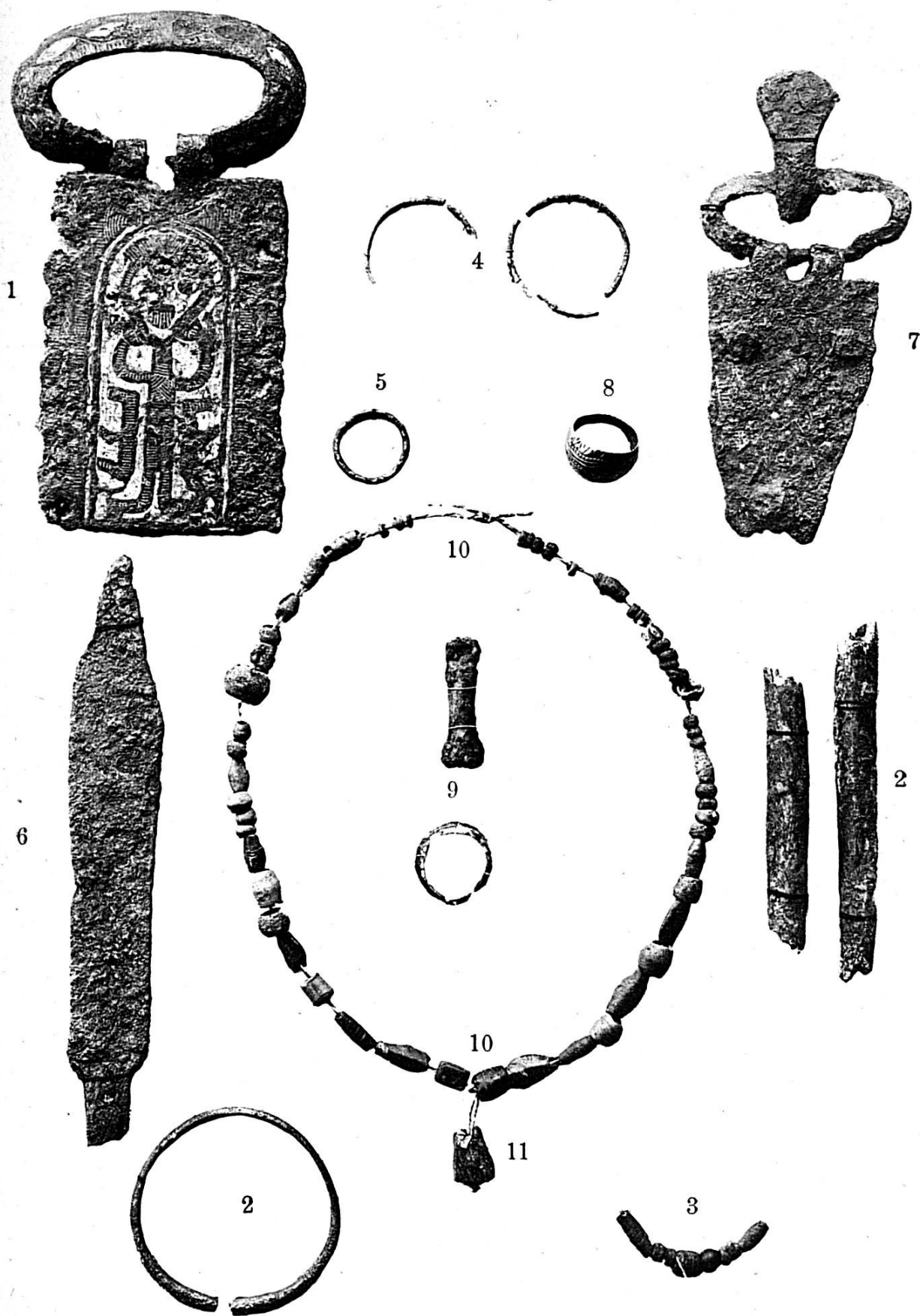
OBJETS TROUVÉS AU „CRAS-CHALET.“