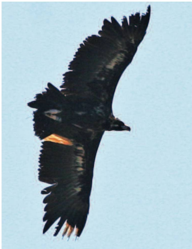
Fig. 5. En vol, les plumes décolorées sont bien visibles. Alle (JU), 12.06.06.

Je décide de suivre l'oiseau en voiture. Je prends l'autoroute à l'entrée de Porrentruy et me dirige vers l'est, en suivant la vallée de l'Allaine. Je quitte l'autoroute à Courgenay et roule vers Cornol, quand je vois le vautour moine qui tourne dans une ascendance avec deux buses variables Buteo buteo et deux milans royaux Milvus milvus , dans la plaine, à l'est du village d'Alle. Je n'en crois pas mes yeux. Les autres rapaces semblent si petits à côté de lui (fig. 5 et 6)! Il est méchamment chahuté par une des buses qui n'apprécie pas du tout sa présence sur son territoire (fig. 7). Le grand oiseau esquive facilement toutes les attaques, mais l'acharnement de la buse locale énerve le charognard qui décide de poursuivre son chemin. Sans un coup d'aile, il file à toute vitesse vers le nord-est, vers l'Alsace, vers la France. Satisfait d'avoir pu partager quelque temps la vie du grand voilier, je décide de rentrer à la maison et de regarder les photographies réalisées.