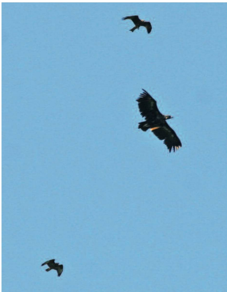
Fig. 6. Une buse variable (en bas) et un milan royal (en haut) volent avec le vautour moine.

Alle (JU), 12.06.06.