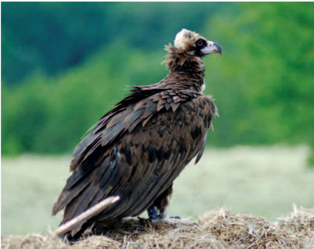
Fig. 9. Le vautour moine «Caire» en Moselle. Hottwiller, 19.06.06.