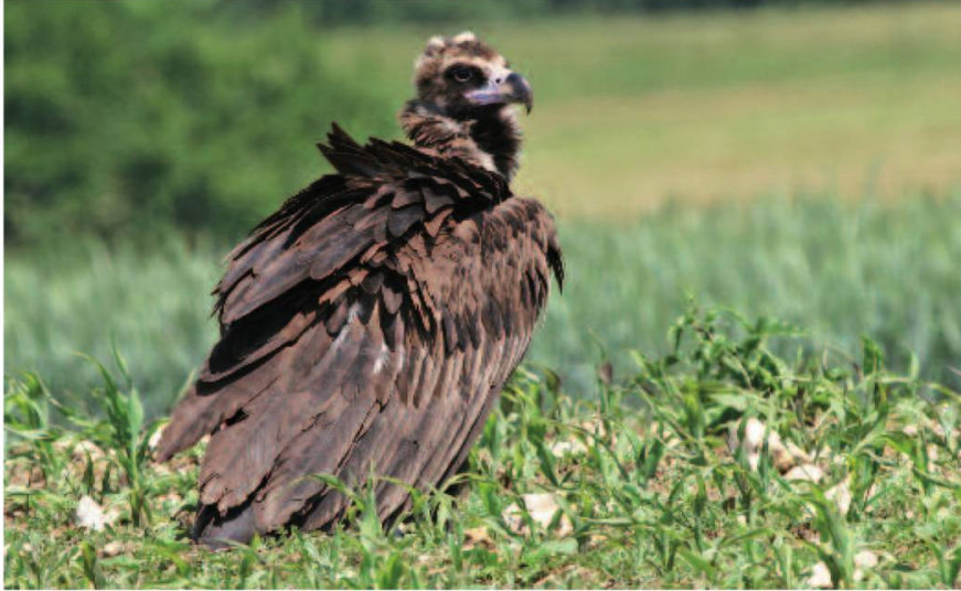
Fig. 2. Le grand oiseau montre des signes d'inquiétude à notre approche. Bressaucourt (JU), 12.06.06.