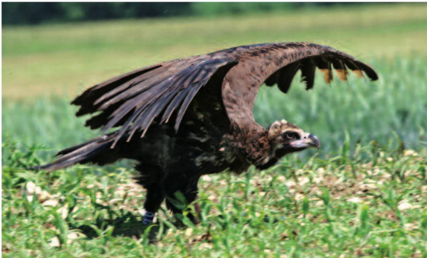
Fig. 3. Il écarte les ailes et s'envole. Bressaucourt (JU), 12.06.06.