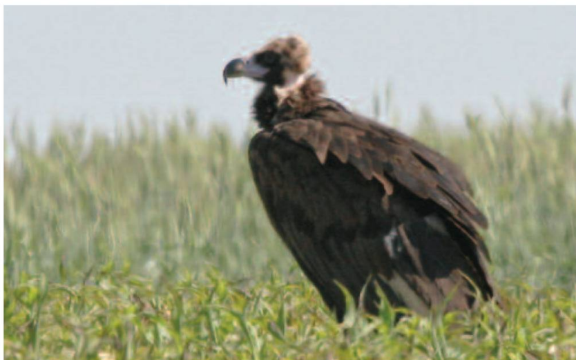
Fig. 1. Le vautour moine est posé dans un champ de maïs. Bressaucourt (JU), 12.06.06.