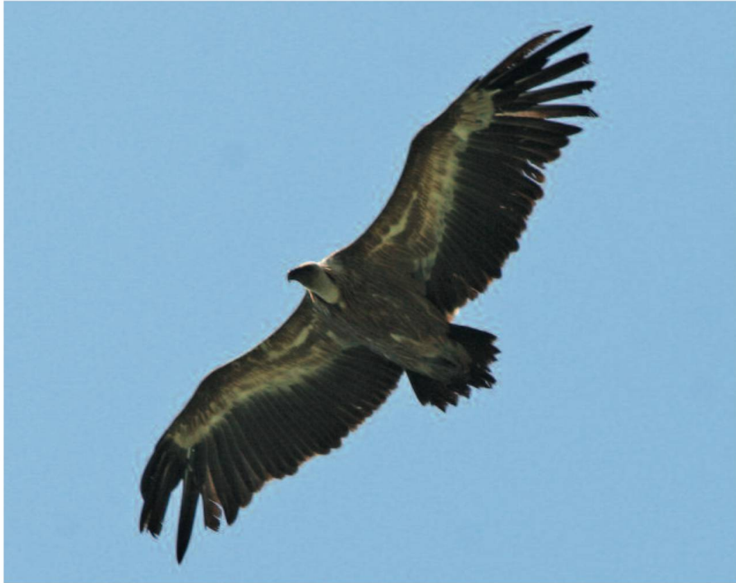
Fig. 11. Le vautour fauve est aussi un grand planeur. Roncal, 20.07.06.

Ces derniers se déplacent fréquemment et il n'est plus rare aujourd'hui d'en observer dans notre pays, parfois plusieurs dizaines dans la même ascendance (cinquante-quatre individus le 28 mai 2005 à Baulmes (VD), Pierre-Alain Ravussin, comm. pers.). Ces déplacements sont à mettre en relation avec une phénologie saisonnière des oiseaux réintroduits et il est probablement trop tôt pour affirmer avec certitude que ce phénomène s'est amplifié, depuis que les vautours fauves espagnols subissent des privations de nourriture, suite à la nouvelle législation, appliquée en Castille-Léon et Aragon, dès 2005, qui interdit les charniers en plein air (Alvaro Camiña in Choisy 4 ). Conséquence, depuis 2006, les vautours fauves espagnols errent un peu partout, chez eux et du côté français des Pyrénées, à la recherche de la moindre carcasse. Il suffit qu'une curée ait pour cible un animal de rente (vache ou cheval), pour que certains éleveurs les accusent de tuer pour manger, comme l'affirmait un article qui titrait: cinquante vautours attaquent un poulain (Revue «Cheval Magazine» n° 428, 2007). Les spécialistes des vautours ont toujours minimisé ces attaques, les grands oiseaux étant surtout charognards, mais il semble que, la faim aidant, certains vautours soient capables d'attaquer, en groupe, un animal qui est en train de mettre bas (Yves Thonnérieux, comm. pers.). Toutefois, ce type de comportement reste heureusement très rare.