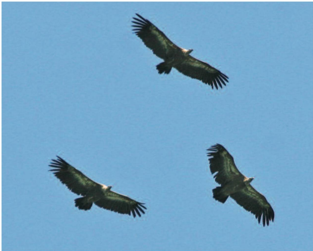
Fig. 10. Un groupe de vautours fauves dans le ciel des Pyrénées espagnoles. Roncal, 20.07.06.

Dans la quête d'un territoire, ils peuvent effectuer des déplacements considérables, de plusieurs centaines de kilomètres en été. Grands voiliers, les vautours ne rechignent pas à passer les montagnes et ce qui est vrai pour les «moines» l'est aussi pour les «fauves». En effet, les vautours fauves Gyps fulvus (fig. 10 et 11), qui nichent régulièrement dans les sierras espagnoles et dans les Pyrénées, ont été les premiers à être réintroduits dans les Grands Causses (1968), dans les Baronnies (1996) et plus récemment dans le Diois (Drôme) ainsi que dans les Gorges du Verdon (1999).