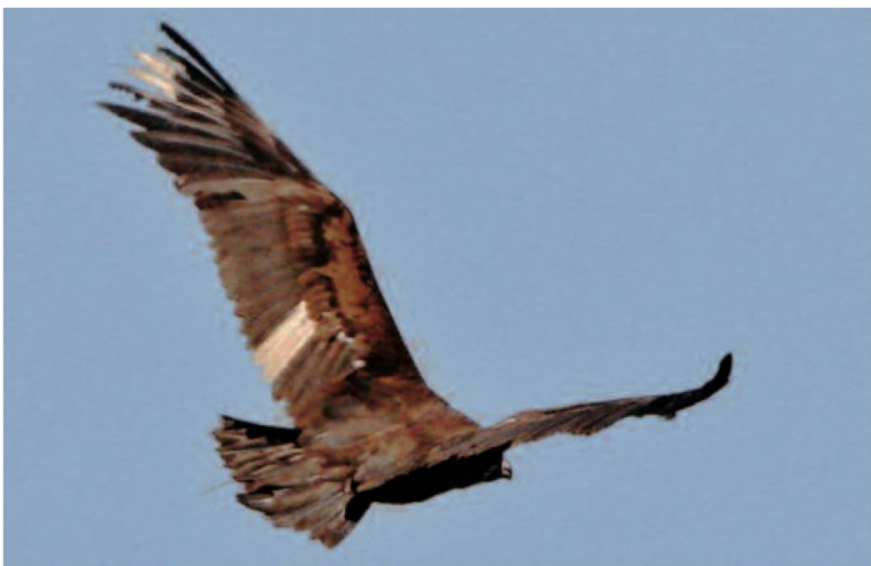
Fig. 4. Le vautour moine vole au-dessus de la plaine. On aperçoit parfaitement bien les plumes décolorées sur son aile gauche et l'antenne d'un émetteur qui dépasse de sa queue. Bressaucourt (JU), 12.06.06.