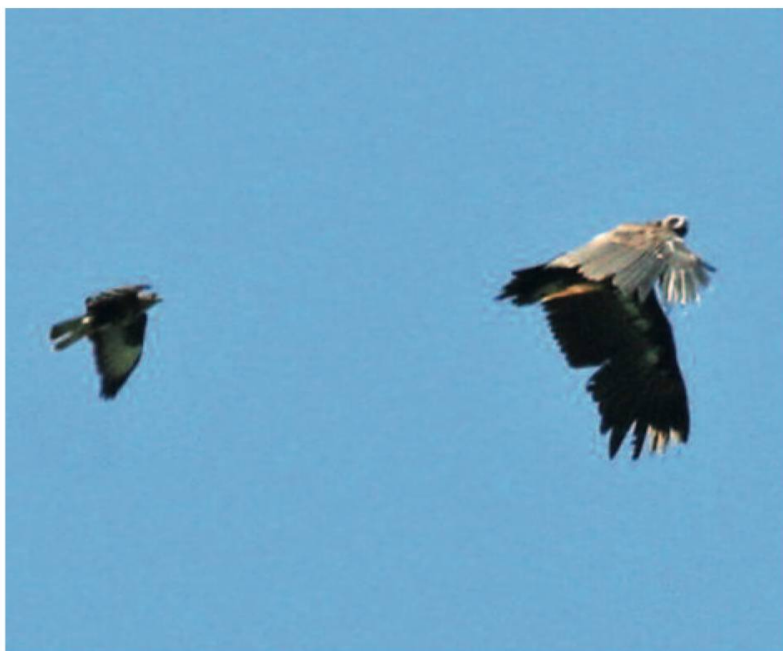
Fig. 7. La buse variable attaque le vautour moine.

Alle (JU), 12.06.06.