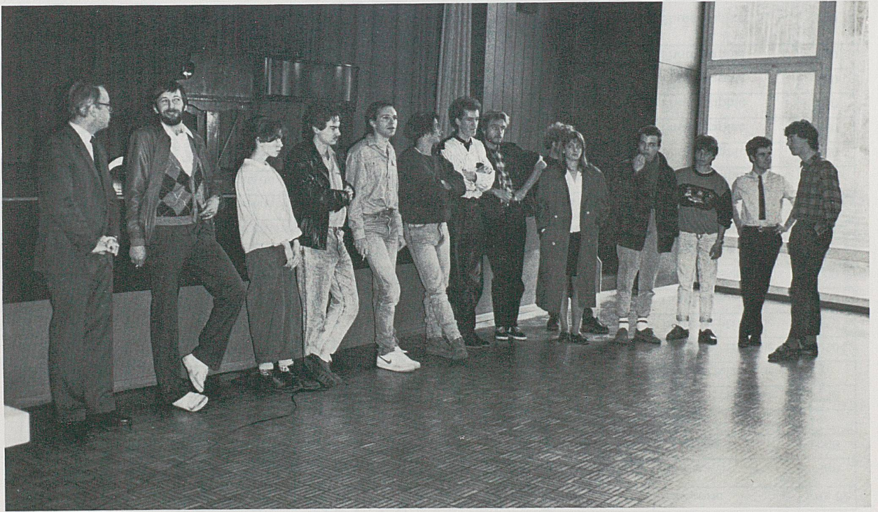
Le président Philippe Wicht (à gauche) félicite les lauréats