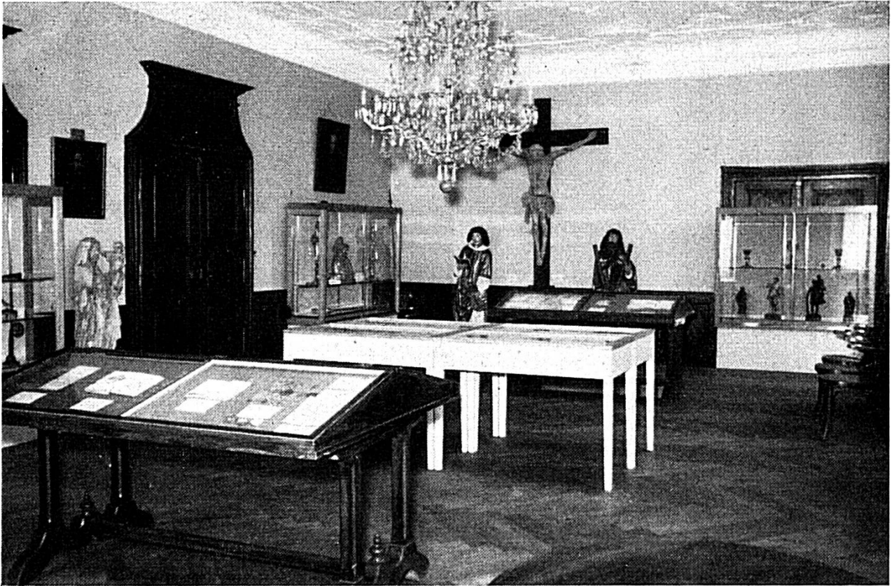
Vue partielle de l'Exposition

Les Pennies, ou Arrivée d'une dame en l'autre monde habillée en panier, par Ferdinand Raspieler, curé de Courroux, 1736. (Musée jurassien).