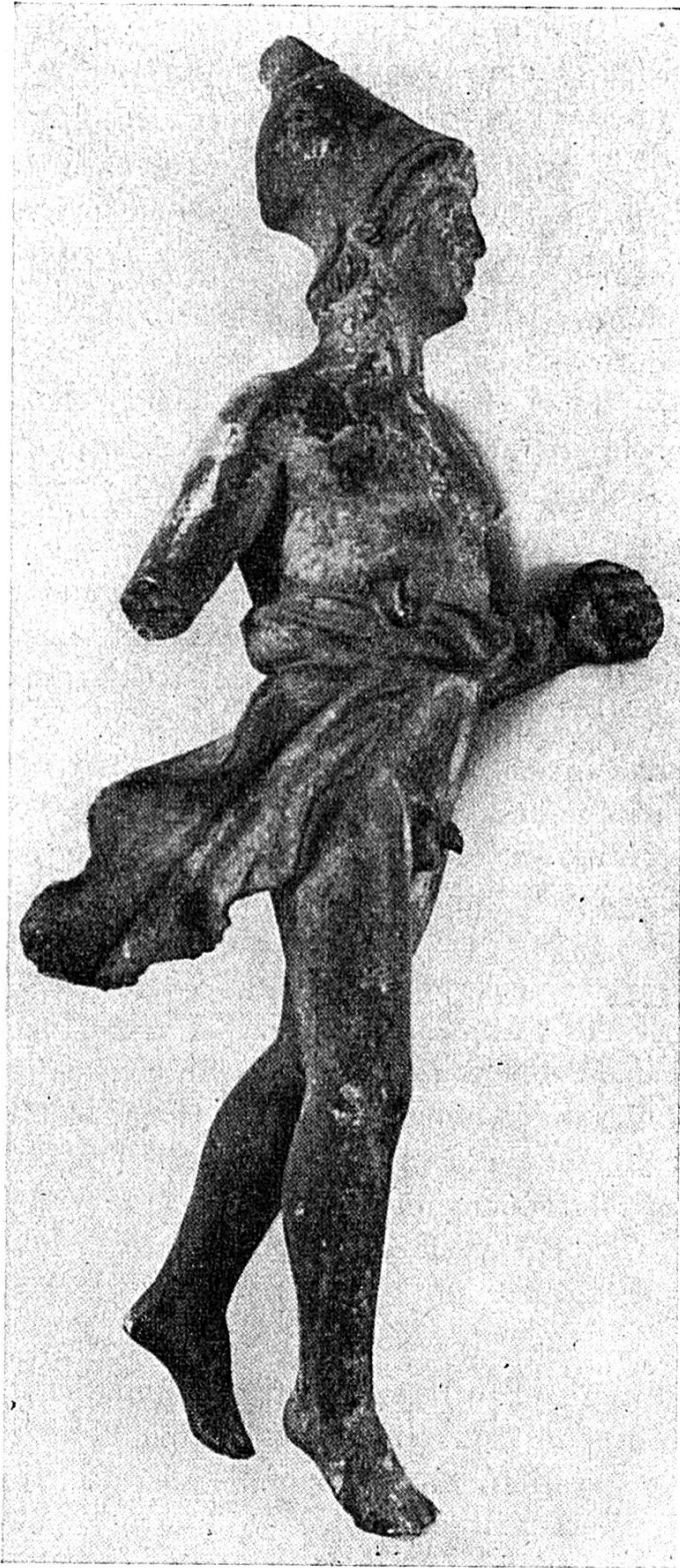
Le Mars tropaeophore de Courroux