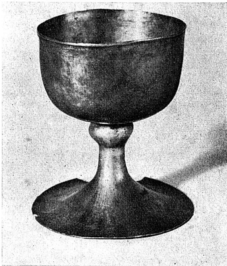
Le calice pré-roman de Moutier-Grandval, probablement d'origine syrienne Hauteur 7 cm. Diamètre de la coupe 5,9 cm. Diamètre du pied, 6,4 cm. Diamètre de la patène 7,3 cm. VI-VIIe siècle