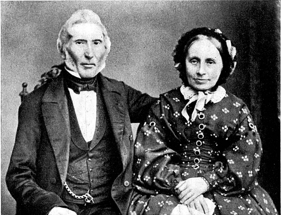
Les parents du poète

aperçoit-on tout entier. Tel absolument qu'il est, sans fard. Non, ce qu'il raconte là, il ne se dit pas qu'un jour, ce sera publié. Toute éloquence est bannie de ces soliloques, rédigés dans le style le plus sobre, le plus dénué d'artifices. Pas question, pour le jeune Tièche, qui ne destine qu'à lui-même ces rapports quotidiens, de se composer une attitude, celle qui lui irait le mieux. Rien d'apprêté, de truqué. La vérité, dans son plus simple appareil.