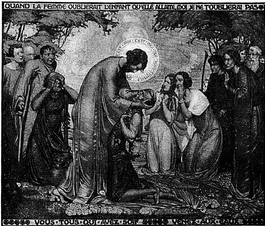
La guérison du lépreux