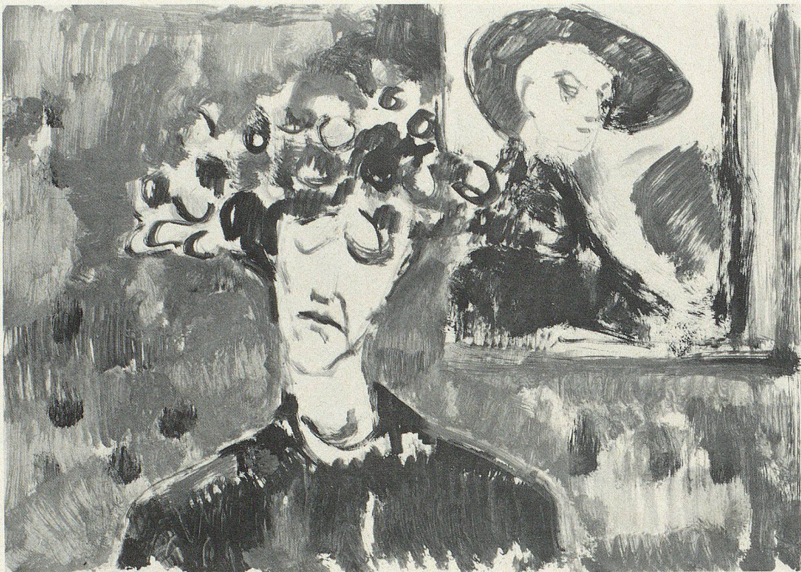
«Alte Dame» Gouache ca. 1960 70×50 cm