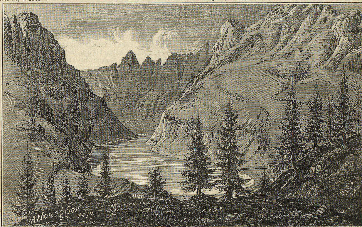
Fählensee 1459 m.

aber wer wollte deshalb die Berge verantwortlich machen hiesfür? Wie Viele verunglücken nicht mit ihrer eigenen Equipage, ihrem pelzgefütterten Galaschlitten; wie mancher Metzger, der Morgens stolz ausfährt, muß Abends mit zusammengerähten Gliedmaßen heimspedirt werden; hat nicht diesen sog. Sommer selbst Kaiser Wilhelm eine kurze Spazierfahrt mit einem verstauchten Fuß bezahlt? Drum sei nicht neidig, junger Leser, auf die Karosse, die an dir vorbeisauzt; jene oft gelangweilt dreinschauenden Insassen haben alle Ursache dich zu beneiden um dein kräftigstes Selbstbewußtsein, das dir erlaubt, auf eigenen Füßen zu stehen. . . .