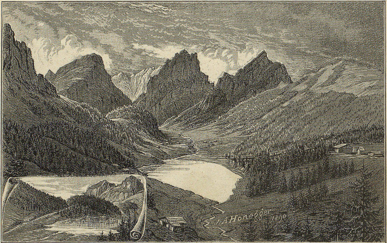
Semtißersee 1270 m.

Ferienstation dieser Gattung Armer — vorzüglich eignen. Der bequemste Säntisweg, für Kinder und Veteranen jeden Alters noch gangbar, zieht sich über Auen, Hütten- und Meglisalp; doch Eines laß dir gesagt sein: eile mit Weile! Wer sich eines schönen Abends rudelweise auf den Säntis hegen läßt, um todtmüde, verschwitzt, übernünftig und appetitlos droben anzulangen, dem geht die wundervolle Fernsicht verloren, auch wenn die Berggeister ihm gnädig sind. Wenn aber erst ein plötzlicher Umschlag der Witterung den Wanderhumor auf seine Rechtheit prüft; wenn das Wolfengefindel mit seiner Siebkanne allerlei Mlotria treibt, dann halten nur Wenige Stand. Mit leichtem Beutel und schweren Beinen manken die Gestalten, bis zur Unkenntlichkeit verummmt,