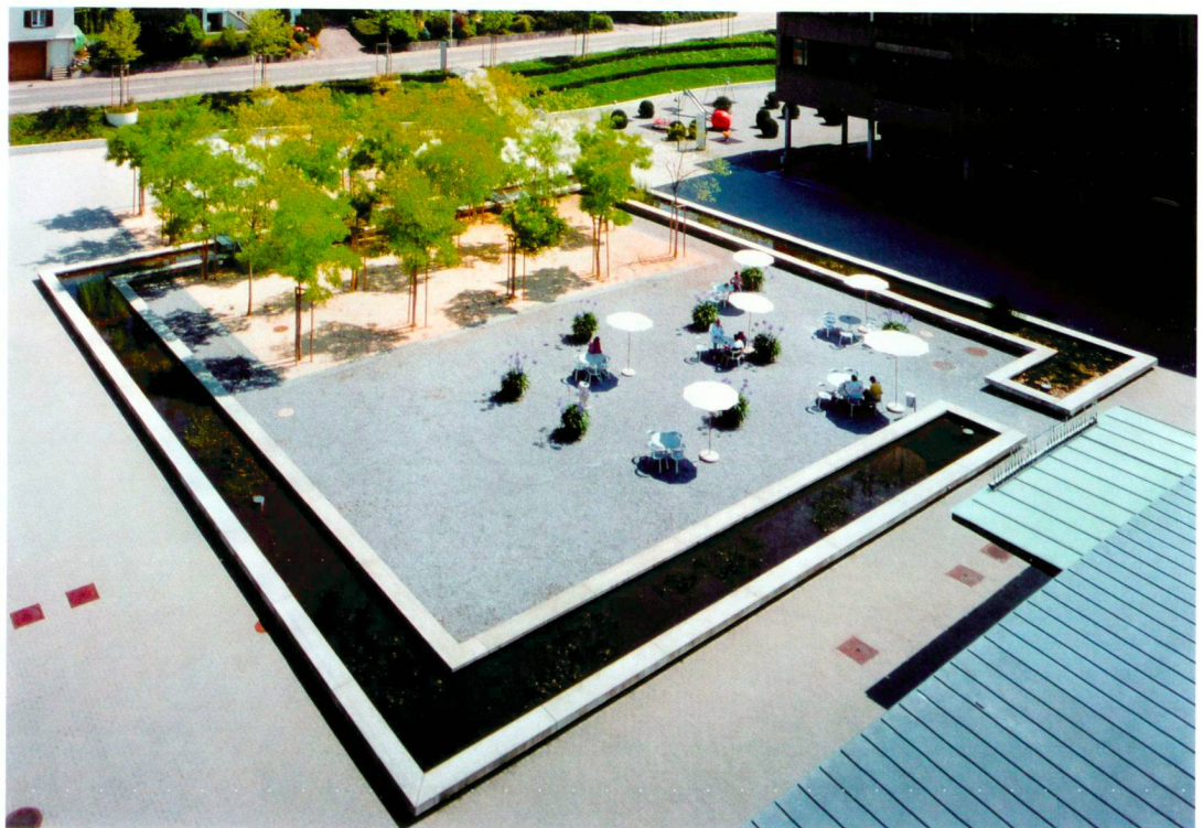
Eingangsplatz der SUVA-Rehabilitationsklinik Bellikon.

La tâche englobe l'aménagement entier des espaces extérieurs des nouveaux bâtiments publics, à savoir le home pour personnes âgées, des appartements pour personnes âgées, la maison paroissiale, la bibliothèque et l'église réformée existante. Entre le home pour personnes âgées et l'église avec la maison paroissiale, s'ouvre un espace vert agrémenté par le ruisseau (Pflanzer-