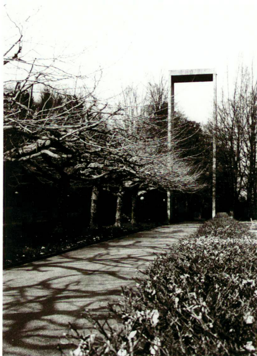
Haupteingang Friedhof Liebenfels, Baden, 1957, Architekten: Edi und Ruth Launers.

Diese Anlage bildet ein herausragendes Beispiel eines über Jahre gewachsenen Park- oder Waldfriedhofs: der Landschaft angepasste Wegführungen, wechselnde, verschiedenartige Räume, die im Süden und Westen mit dem Stadtwald verschmelzen. 1957 fügte man der Anlage einen Gebäudekomplex mit Krematorium, Abdankungshalle, Werkhof und Gärtnerhaus sowie einen neuen Haupteingang hinzu. Daneben wurde ein Urnengräberbezirk mit streng geometrisch angeordneten Platanen angelegt. Ende der 70er-Jahre stand eine nächste Erweiterung bevor, deren Ziel es war, die beiden bestehenden, gut zusammenwirkenden