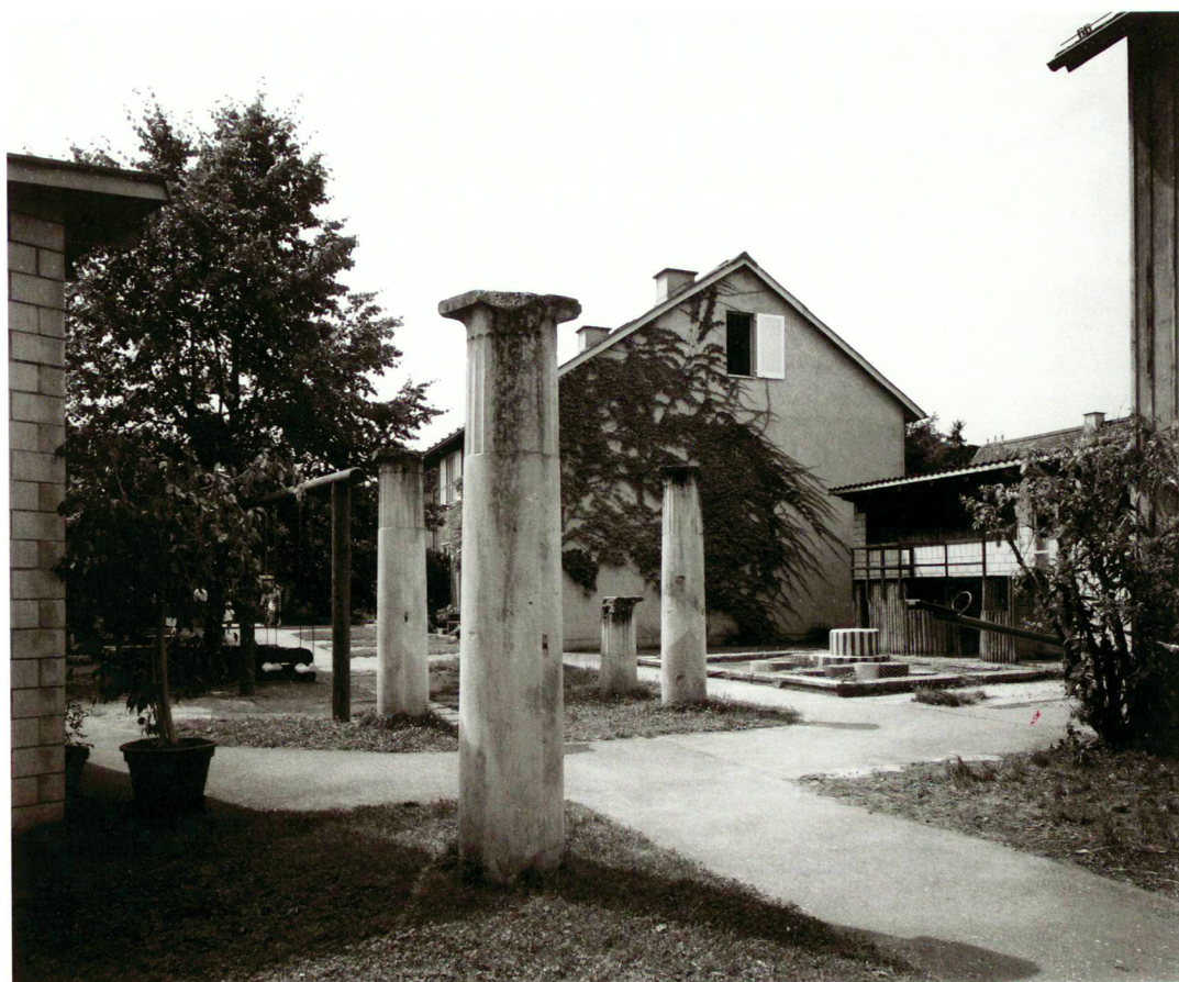
Zentraler Platz Siedlung Zelgli, Windisch.

Les architectes-paysagistes argoviens ont conçu des jardins et des parcs qui rayonnent largement au-delà des frontières cantonales.