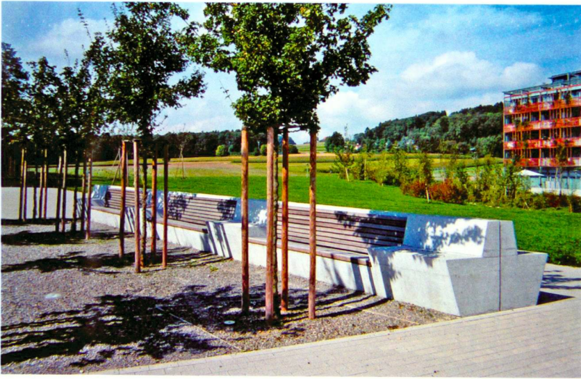
Parkähnlicher Freiraum der öffentlichen Bauten Widen.

Aménagements extérieurs des bâtiments publics Widen.