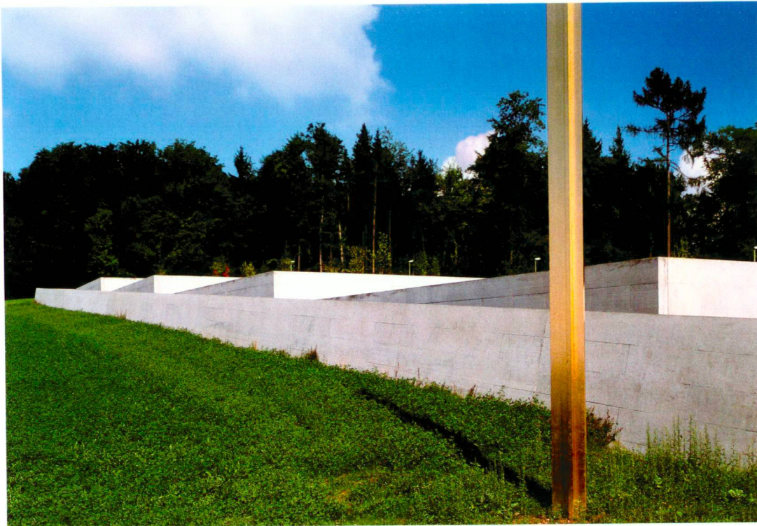
Friedhof Kirchberg, Küttigen.