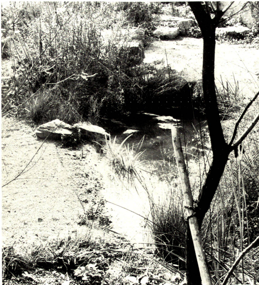
Einblicke in die wohnliche Garten-Natur zur Mehrfamilienhaus-Siedlung in Wollishofen/ZH. Gestaltung und Fotos: Dr. Dieter Kienast, Landschaftsarchitekt BSG, Zürich

The sand pit is now hardly ever used as the children have grown out of that age, and hardy herbaceous plants and shrubs have settled there. Beside it is a table-tennis tabletop which is used not so much for ping-pong as for games of hide and seek.