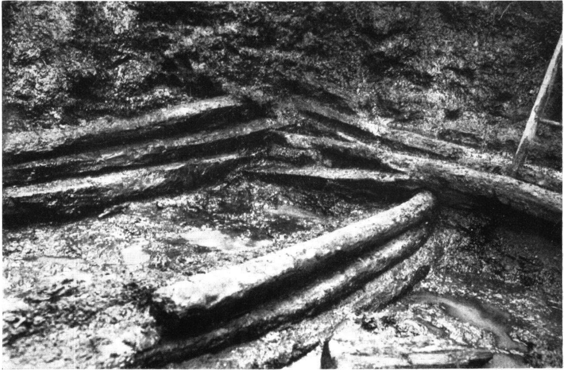
Blockwände eines Stalles auf der Rieslen. (In 5 m Tiefe.)