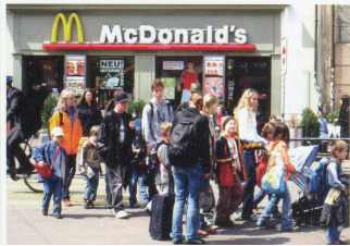
Bildlegende Seite 2: Treppe auf dem Barfüsserplatz Oben rechts: Grand Café Huguenin Oben: Brasserie «Zum braunen Mutz» Unten rechts: Stadtreinigung bei Tramhaltestelle Barfüsserplatz Unten links: Mc Donalds am Barfüsserplatz

Kreis Georg/von Wartburg Beat (Hrsg.), Basel – Geschichte einer städtischen Gesellschaft, Basel: Christoph Merian Verlag, 2000. Schneitter Andreas, Kalbskopf und ein Grosses. Eine Kirche im Dorf und Landbeiz in der Stadt: die Brasserie «Zum Braunen Mutz», in: baz, 8.2.08