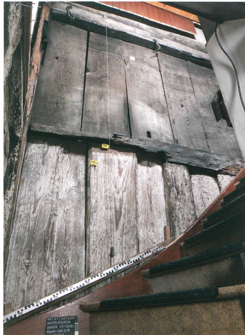
Abb. 7: Wiedlisbach, Städtli 19. Bohlenwand im ersten und zweiten Obergeschoss. Im Spätmittelalter war die Wand zwischen dem Wohnbau und dem zugehörigen Tenn eingebaut worden.

Im Gebäude Städtli 21, das seit etwa 1540 in den Quellen als «Bürger- und Rathaus» fassbar ist, lassen sich im ausgehenden 17. Jahrhundert weitere Umbaumasnahmen feststellen. Auf der Gassenseite wurde damals das Dach angehoben (Abb. 6, grün). Auch die jetzige Fenstergliederung der Fassade stammt aus dieser Zeit. Raumeinteilungen im zweiten Obergeschoss und der Einbau einer fischgratförmig verlegten Schieb- bodendecke im ersten Obergeschoss deuten auf eine umfassende Modernisierung auch im Inneren hin. Ein Dendrodatum der Decke weist in die Zeit um 1690. Weitere Anpassungen am Gebäude erfolgten im 18. und 19. Jahrhundert. Die auffälligste Massnahme wurde 1739 realisiert, als gassenseitig der heutige Quergiebel (Abb. 6, orange) eingebaut wurde. Dadurch sollte das neu montierte Uhrwerk zur Geltung gebracht werden. Der Neubau verursachte im Dachwerk allerdings erheblichen Schaden an der Statik. Anpassungen der Deckenhöhen und der Raumgliederungen des Gebäudes verschärften die prekäre Bausituation im Bereich des Dachreiters weiter. Im 19. Jahrhundert musste deshalb eine massive Unterfangung (Abb. 6, dunkelblau) eingebaut werden. Insbesondere im Erdgeschoss folgten im 20. Jahrhundert weitere Anpassungs- und Modernisierungsmassnah-