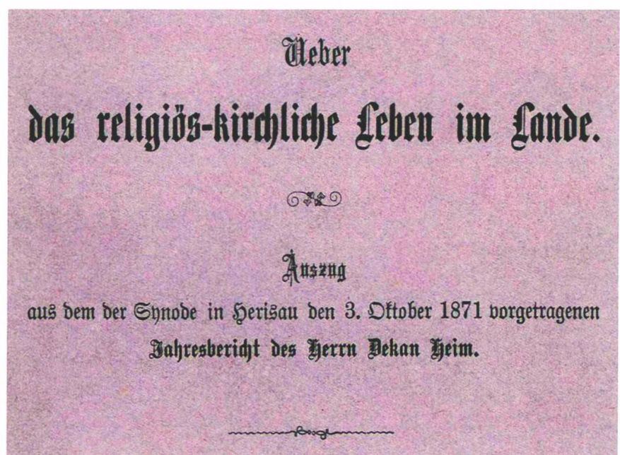
Titelseite der wegweisenden Abhandlung «Über das religiös-kirchliche Leben im Lande» von Dekan Heinrich Jakob Heim.

1886 reflektierte Heim in den Jahrbüchern unter dem Titel «Die neueste konstitutionelle Entwicklung der reformierten Landeskirche von Appenzell A.Rh.» die Jahre der Umgestaltung der evangelisch-reformierten Kirche von der Staatskirche zur Landeskirche. 60 Die fundierten sitten- und kirchengeschichtlichen Arbeiten verpflichteten: Der nicht minder umtriebige und dem Gesundheitsdiskurs des ausgehenden 19. Jahrhunderts verpflichtete Pfarrer Gottfried Lutz (1841–1908), Präsident des Kirchenrats, Erzieher von Arthur und Howard Eugster und seit 1882 im Einsatz zugunsten einer «kantonalen Irrenanstalt», publizierte 1895 einen 57-seitigen Bericht über das kirchliche und religiös-sittliche Leben im Kanton für die Jahre 1883–1892. 61 Sein Katalog der «religiösen Sekten» umfasste Methodisten, Baptisten, Darbysten, Irwingianer, Swedenborgianer und Anhänger der Heilsarmee in Herisau. In Teufen würden einige Adventisten und Sabbatianer dazukommen. Damit seien alle Sekten aufgezählt, «die bald mehr, bald weniger gesammelt hin und her in den Gemeinden unseres Ländchens auftreten und entweder am eigenen Orte ihre Erbauungsstunden haben, oder auswärts ihre Konventikel besuchen.» Wie schon Heim festgestellt hatte, fanden sich keine Mormonen mehr. Glieder der weniger ausbreitungssüchtigen Denominationen, wie Lutz festhielt,